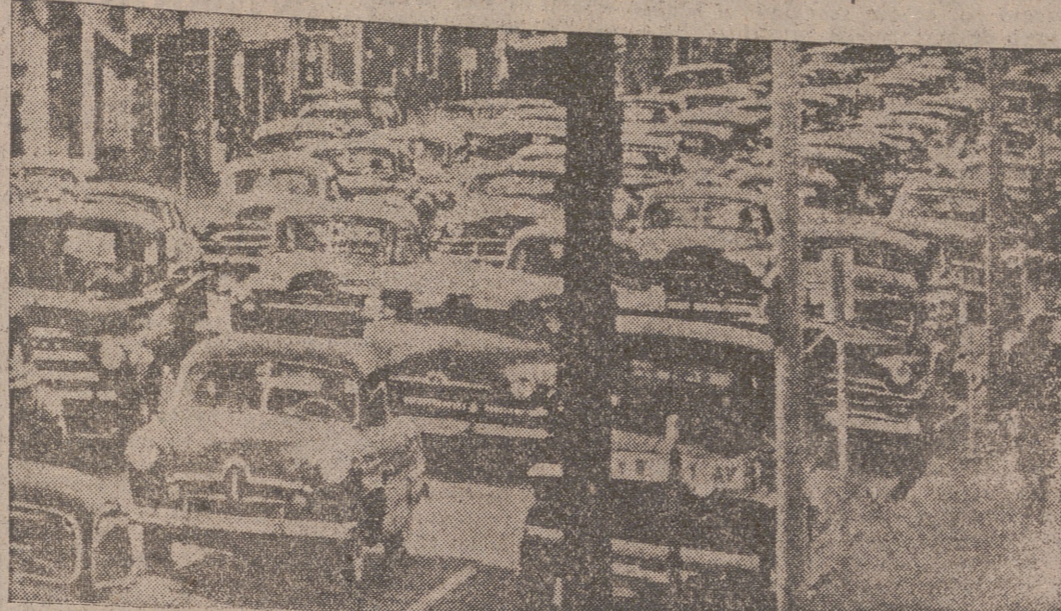
Hamburgo. — (Crónica especial para la agencia "Fiel", por Adolfo Moreno García).—En Hamburgo y existe en el centro de la ciudad un enorme depósito de coches.

Todavía hay 18.000 sin posibilidad de aparcamiento