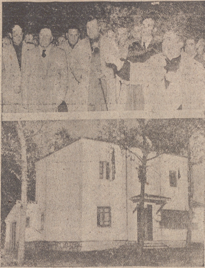
Un momento del acto de bendición del transformador en Quintanarria y una vista del nuevo Centro rural de Higiene, inaugurado igualmente por el Gobernador Civil.—(Fotos Castilla.)