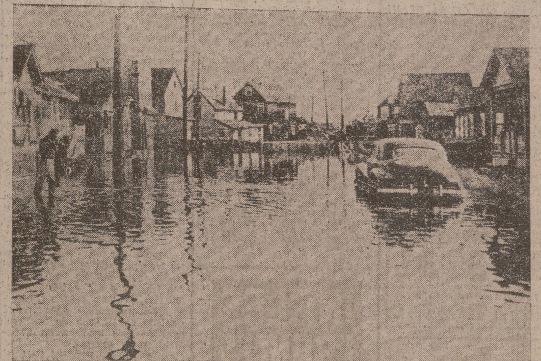
Un aspecto de una calle de Queens (Nueva York) convertida en una laguna dentro de la ciudad, como consecuencia de las lluvias torrenciales y los desbordamientos que han tenido por escenario grandes zonas del Este norteamericano.