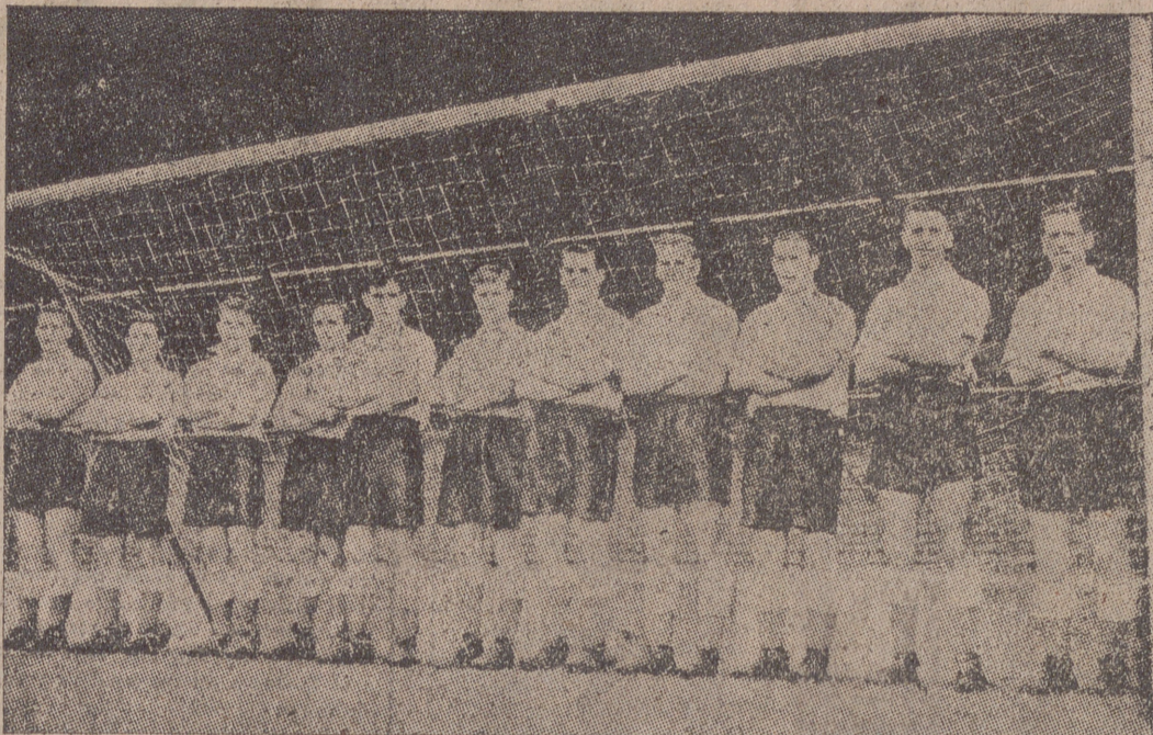
Este es el equipo inglés que hace pocos días venció al de Dinamarca por 5-1. Después de este encuentro parece que la crítica y los técnicos están conformes con la selección que dentro de pocas semanas se enfrentará a la de España, en Londres.