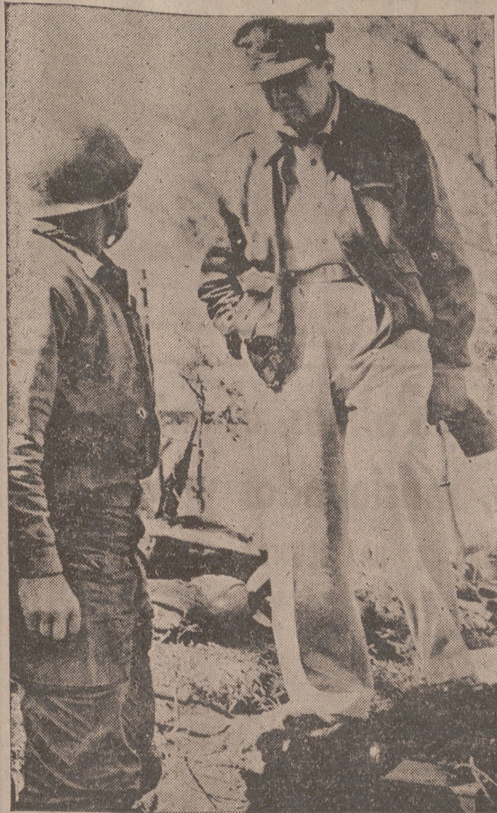
Mac Arthur en los días de su gran popularidad, en el Pacífico

107 páginas para culpar a Mac Arthur de los errores de Yalta Pero el héroe del Pacífico parece estar seguro de su inocencia