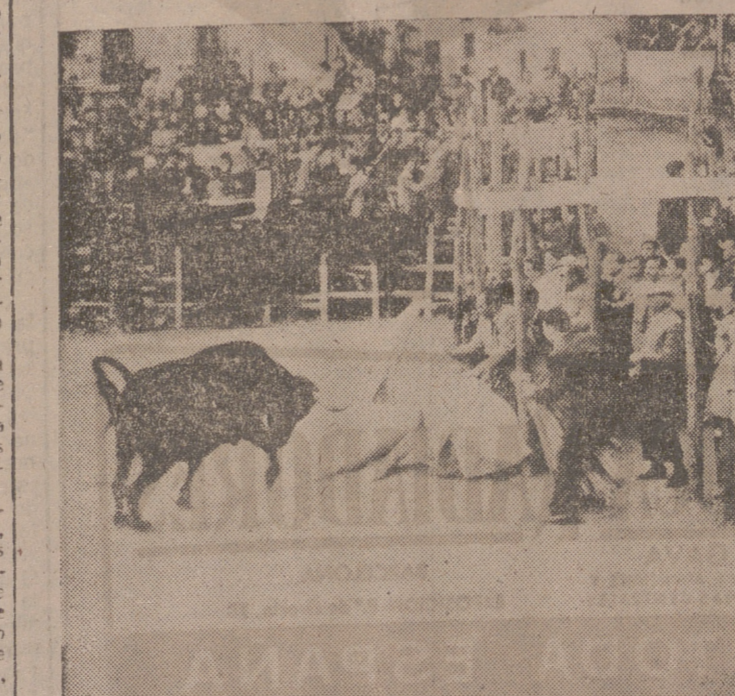
TRUJILLO (Cacería).—Un aspecto de las tradicionales capeas que se celebran por estas fechas en esta ciudad. Aquí vemos uno de los cinco burladeros instalados en el improvisado ruedo, la plaza del Castillo, donde se cobijan los aficionados que desean dar unos capotazos a la res, armandose el consiguiente barullo al querer hacerlo todos a la vez.