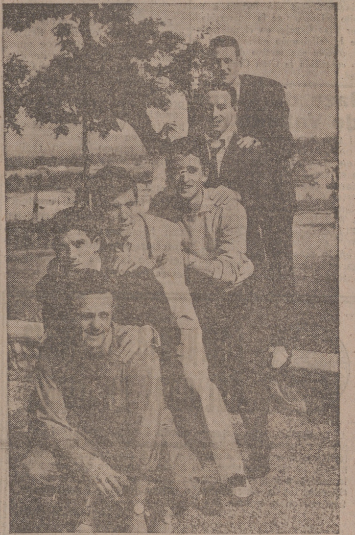
Un grupo de jugadores con la satisfacción propia de la primera foto de la temporada.

La armonía entre jugadores y directivos y de todos con el entrenador, señor Miró, hablaba por sí sola de un futuro esperanzador en la vida del Real Valladolid en las próximas campañas. Toda esa euforia de nervios, zancadillas, envidias y malas intenciones que los aficionados pretenden ver a veces durante la temporada en las relaciones de cuantos integran la familia