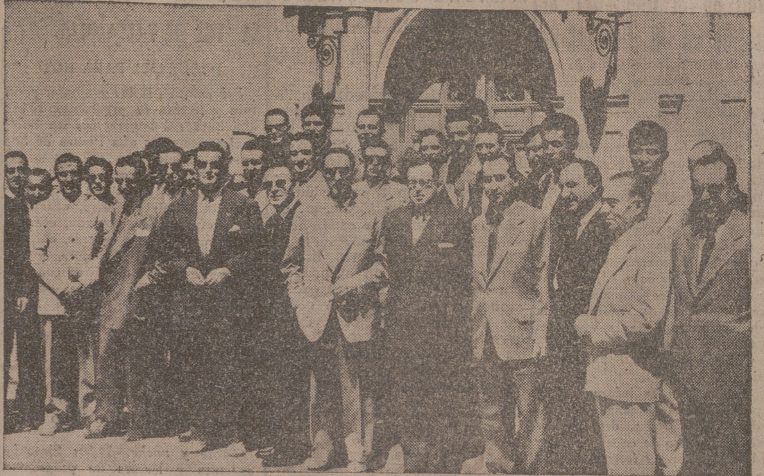
A la salida de la misa ante el altar de la Patrona.