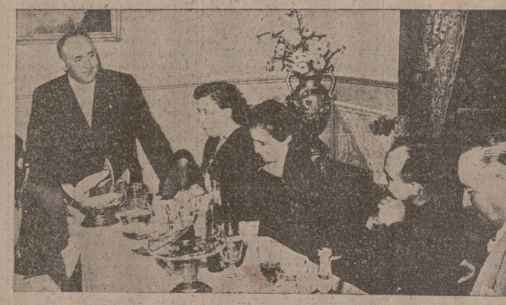
ALMERIA.—El director general de Prensa, don Juan Aparicio, durante su interesante discurso en una comida celebrada en Fijana con motivo de las inauguraciones, el día 18 de julio, de importantes obras en dicha villa.