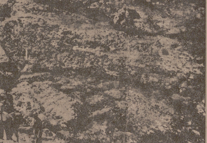
«Acantilado de Somo-Laredo», fotografía de la que es autor don Fernando Esteban, que ha obtenido premio en los concursos mensuales que organiza la Asociación Fotográfica Vallisoletana.