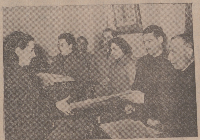
ENTREGA DE DIPLOMAS

No hace siquiera un mes que damos la reseña sobre la clausura de un curso especial de Industrias Lácteas en Villalbaruz de Campos cuando hemos de hablar de un nuevo curso, celebrado en Villalón de Campos. Indudablemente la importancia de cualquier obra emprendida está en el final. Por el sabemos si la tarea fué fructífera, si el trabajo fué fecundo. Y por esta clausura supimos que realmente se trabajó de firme, que una vez más los cursos de la Sección Femenina son algo vivo, efectivo y patente para quien quiera o para quien no quiera entenderlos.