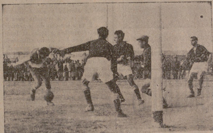
Una fase del interesante encuentro Júpiter-Circular, que ganó aquel por 3-0. El próximo domingo, el Júpiter Lu ses jugará en Salamanca en partido eliminatorio del campeonato de Aficionados.

Se jugó ayer, en el campo de la Federación, el encuentro de fútbol, final de la Copa de Aficionados, entre los conjuntos D. Júpiter y Circular C. F., que terminó con la victoria de aquel por tres goles a cero, consiguiendo dos de ellos en la primera parte. Asistió escaso público, y el partido careció de interés debido al gran dominio del D. Júpiter, que embotelló materialmente a su enemigo, motivo por el cual se lució, en una tarde inspirada, el meta del Circular.