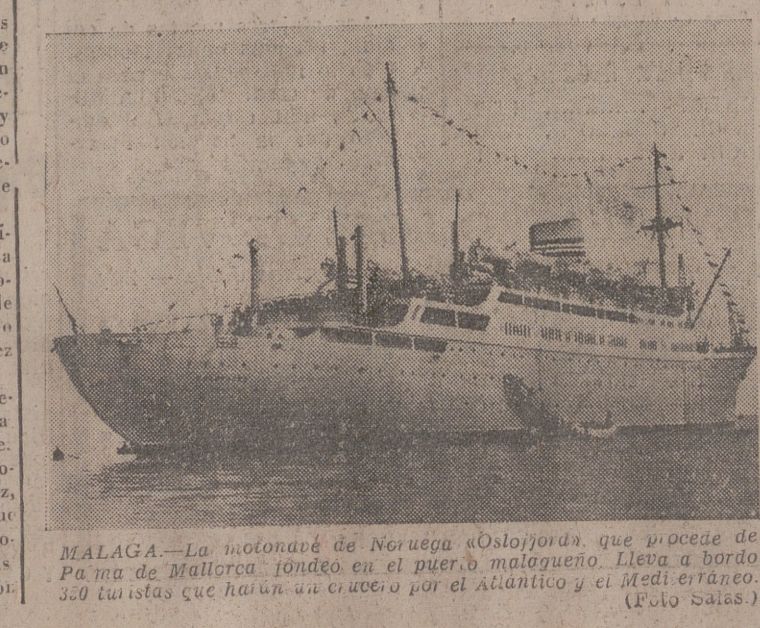
MALAGA.—La motorabre de Noruega «Oslojorda», que procede de Palma de Mallorca, fondeó en el puerto malagueño. Lleva a bordo 350 turistas que han venido en un barco por el Atlántico y el Mediterráneo.