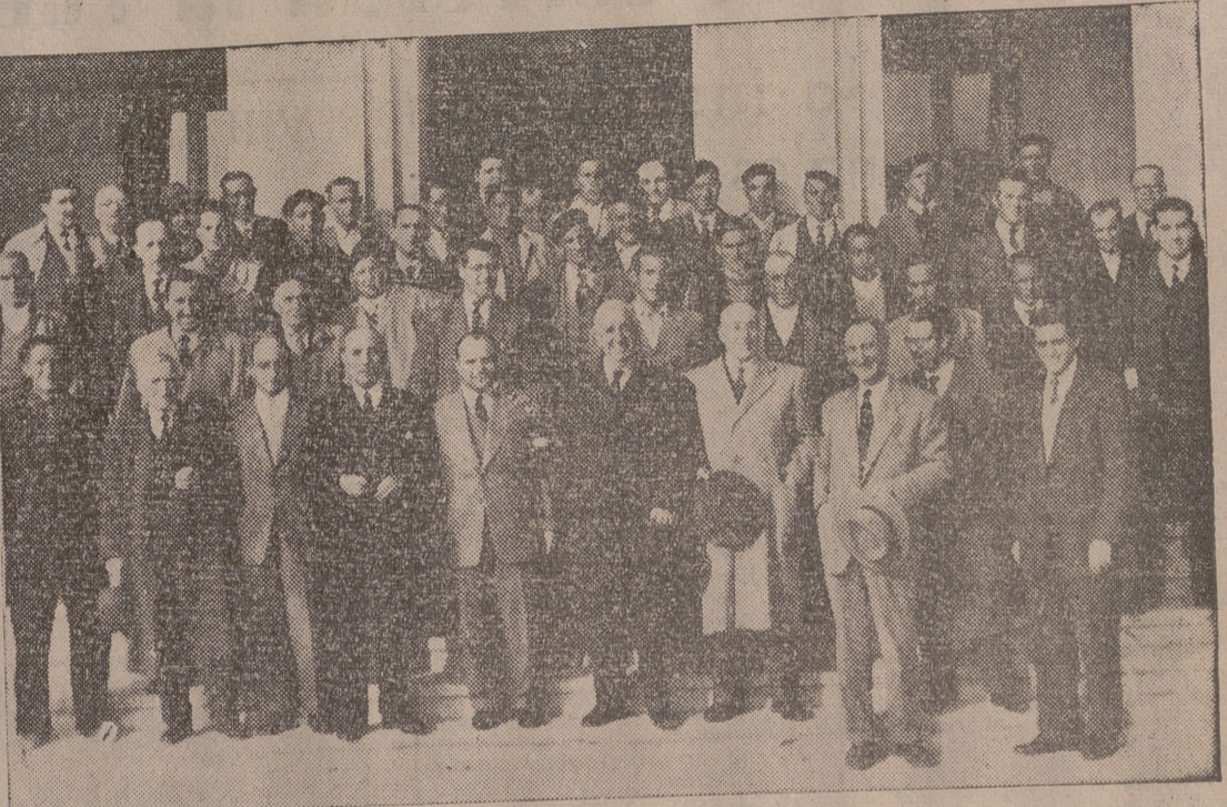
ASISTENTES AL COLOQUIO CON SUS PROFESORES

Asistimos ayer tarde al tercer de los Coloquios que, por iniciativa de la Dirección General de Coordinación del Ministerio de Agricultura, ha organizado la Cámara Oficial Sindical Agraria en la Granja-Escuela José Antonio.