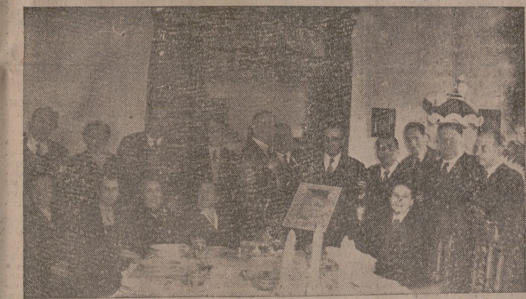
La promoción de Ingenieros de Montes del año 1917, en reconocimiento de los méritos y labor realizada por el Excmo. señor don Paulino Martínez-Hermosilla, director general de Montes, Caza y Pesca Fluvial, le entregó el pasado domingo un artístico pergamino nombrándole compañero de honor de dicha promoción.