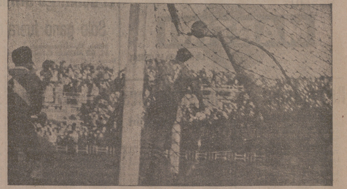
En la salida de un córner logró el Delicias el gol de la victoria, cuando faltaban ya pocos minutos para acabar la lucha. Arsenio metió la cabeza y Guti no pudo detener la pelota. Luego, Burgos adelantaría mucho, aunque sin éxito.