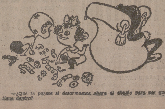
—¿Qué te parece si desarmamos ahora al abuelo para ver qué tiene dentro?

El Cairo, 21.—Los representantes de la secta ismaelita que se encuentran en esta ciudad han iniciado los preparativos para pesar al Aga Khan en 1965 en radio. Calculan que desde ahora hasta entonces se reunirán tres millones de libras. Se proyecta que dicha ceremonia se efectúe a bordo de un avión que vuele sobre las partes de Asia y África donde residen la mayor parte de sus seguidores.—Efe.