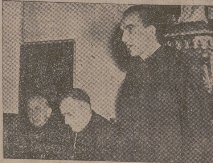
El rector del Seminario, hablando en la reunión.

A las ocho y media de la tarde de ayer se celebró en el Palacio Arzobispal una reunión para encauzar la campaña pro Seminario, que se hace en cumplimiento de los deseos del reverendísimo Prelado, expuestos en su última carta pastoral.