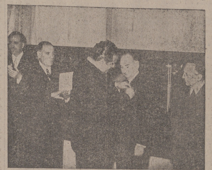
MADRID. — El Ministro de Trabajo en el acto de imponer la Medalla de Oro del Trabajo al Consejero del Reino don José Luis Arrese, en presencia de los Ministros Secretario General del Movimiento, Educación Nacional e Información y Turismo.