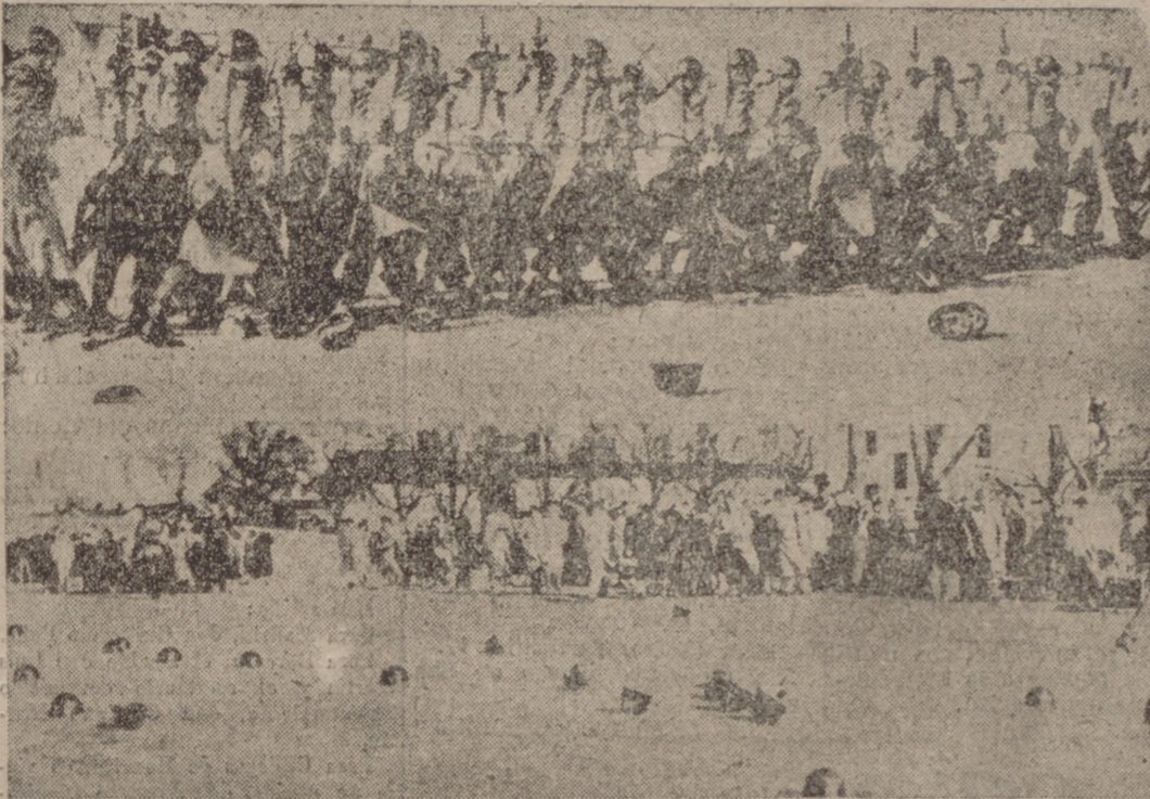
Durante un desfile celebrado en Nueva York, por las tropas del I Ejército de los Estados Unidos, se desencadenó un viento tan fuerte que se llevó hasta los cascos de algunos soldados. Pero el desfile siguió como había empezado, si bien las descomodadas cabezas intentaron restarlo alguna marcialidad.