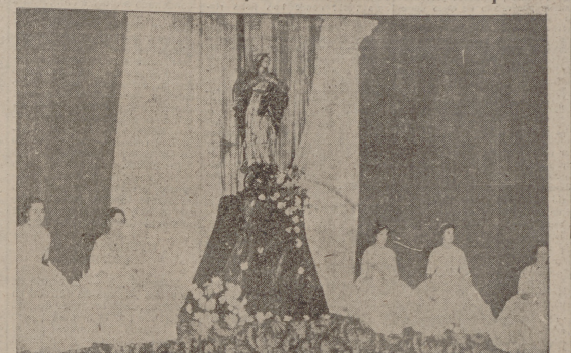
Damas de honor, en torno a la Inmaculada.

MAÑANA PUBLICAREMOS AMPLIA INFORMACION DE ESTOS PARTIDOS)