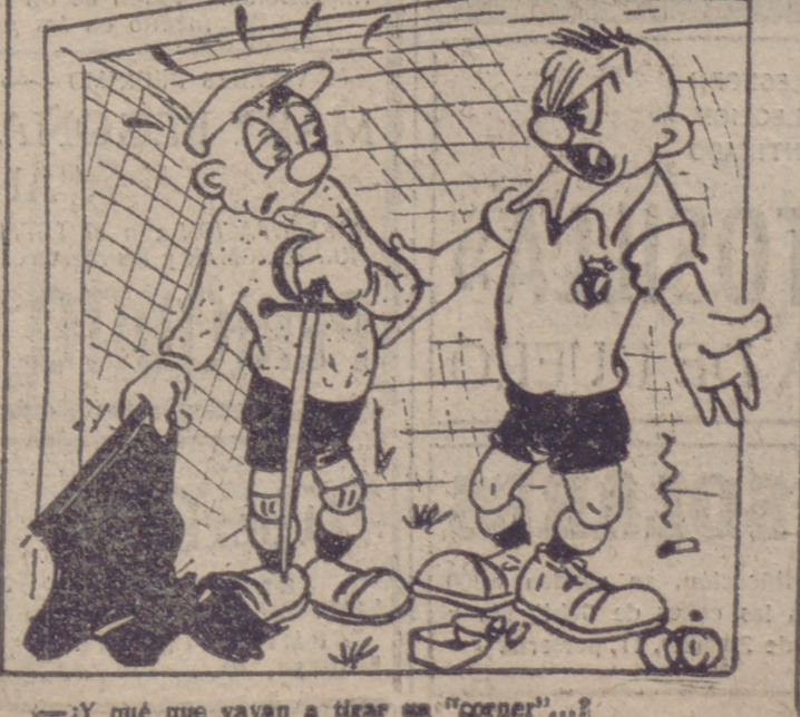
—¿Y qué que vayan a tirar un "coronel"...