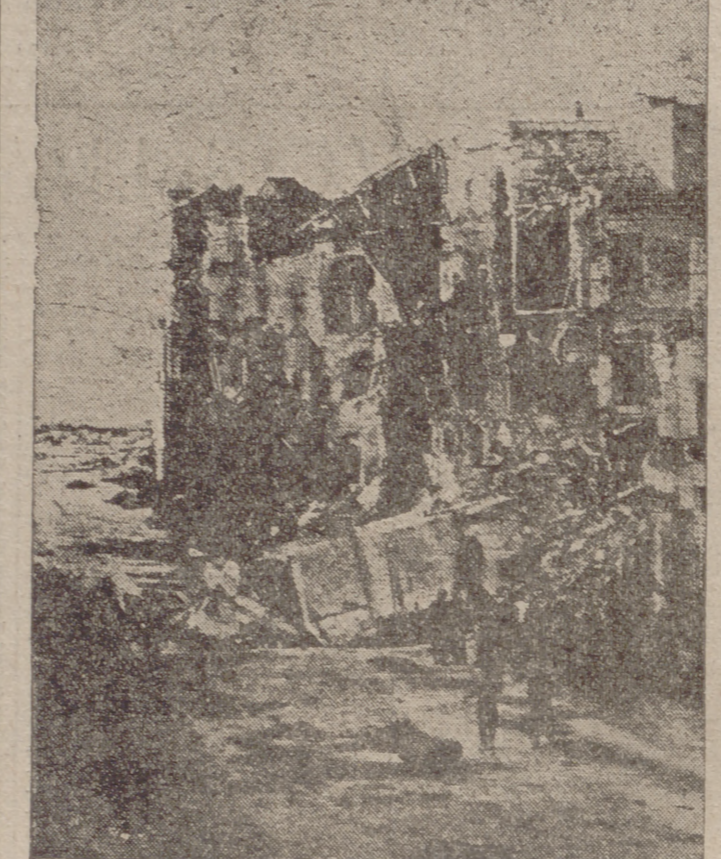
Un temporal de lluvias, con corrimientos de tierras e inundaciones, ocasionó hace unos días cientos de muertos en la zona de Salerno, en Italia. En nuestra fotografía pueden observarse los daños causados en una calle de Amalfi.