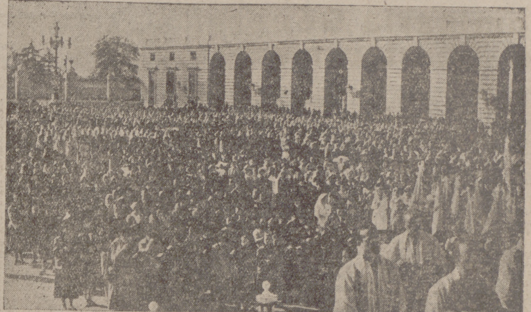
MADRID.—En la Plaza de la Armería se ha celebrado el acto de consagración de las niñas al Sagrado Corazón de María. En el solemne acto religioso, que fue oficiado por el Obispo Auxiliador de Madrid, tomaron parte cerca de veinte mil niñas, que recibieron la Comunión. Aspecto de la Plaza de la Armería durante el acto.