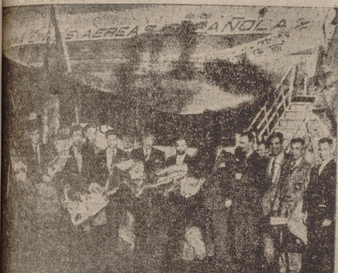
Excombatientes chinos, que "escogieron la libertad", han llegado a Madrid en misión de buena voluntad. En la fotografía aparecen pocos minutos después de haber descendido del avión en Barajas.