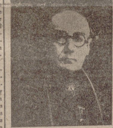
El Dr. Pla y Deniel, Legado pontificio en el Congreso Mariano.

Después de este acto, el director general de Información inauguró oficialmente también la Exposición del Libro, instalada en el Paseo de la Independencia, y en la cual colaboran el Consejo Superior de Investigaciones Científicas, la Editora Nacional, el Instituto «Fernando el Católico».