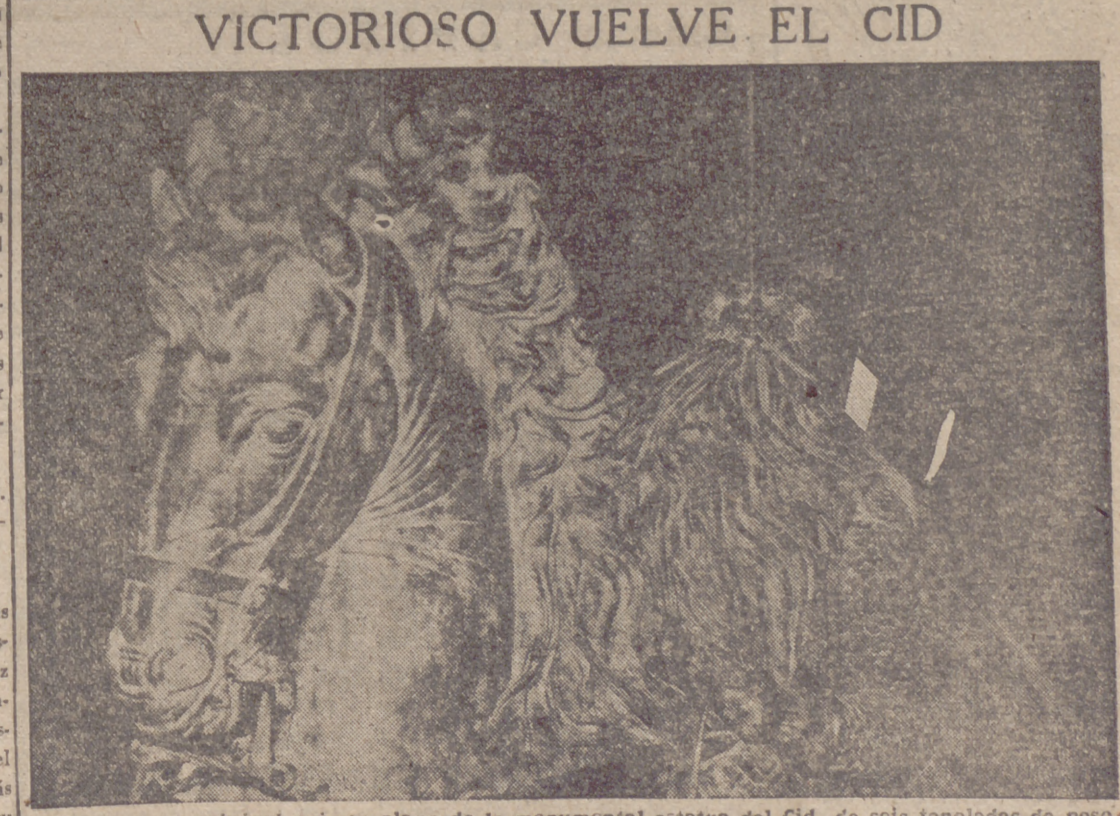
He aquí un original primer plano de la monumental estatua del Cid, de seis toneladas de peso; obra del escultor Juan Cristóbal, que será inaugurada en Burgos.

Barcelona, 7.—El próximo día 16 se espera llegue a este puerto el buque «Excalibur», a bordo del cual viene en viaje oficial a España el mariscal Alejandro Papagos, presidente del Consejo de Ministros de Grecia. Para recibir al mariscal Papagos se desplazarán a Barcelona el ministro de Asuntos Exteriores, señor Martín Artajo, con el séquito español del mariscal Papagos, y el embajador de Grecia, señor Diamantópulos. Durante su estancia en la Ciudad Condal el mariscal visitará los principales monumentos de la misma, las factorías y principales centros de su zona industrial, y continuará luego en tren su viaje a Madrid.—Cifra.