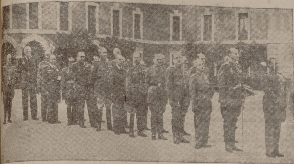
Los oficiales que integran la XXII promoción del Arma de Caballería.