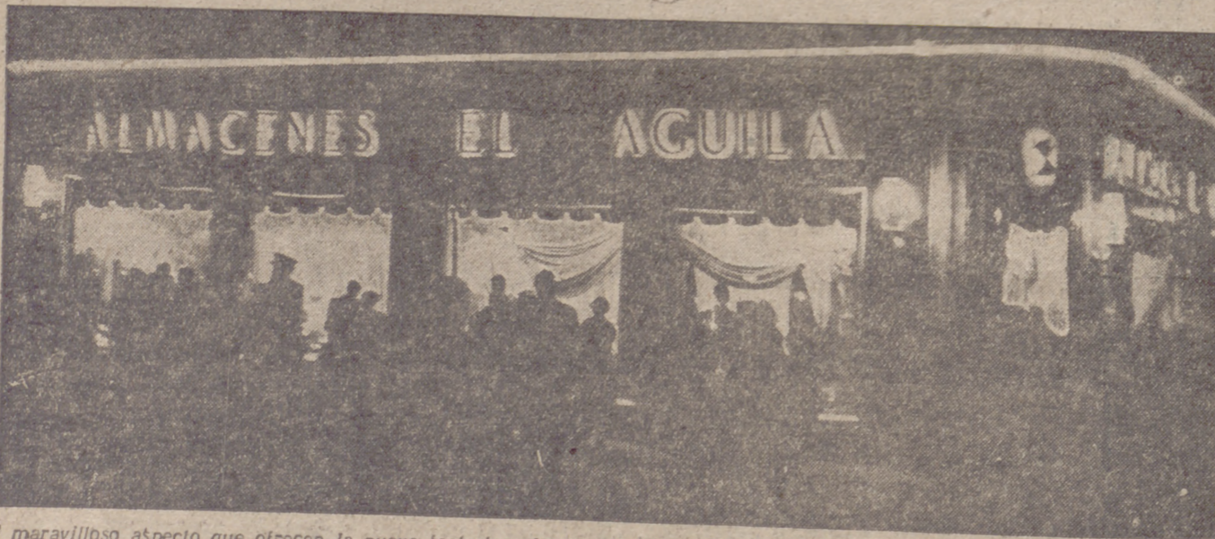
El maravilloso aspecto que ofrecen la nueva fachada y los escaparates, atraen poderosamente la atención de los transeúntes

Ayer, a las siete y media de la tarde, tuvo lugar la inauguración oficial de las nuevas y suntuosas instalaciones de la Sucursal en esta capital de Almacenes "EL AGUILA".