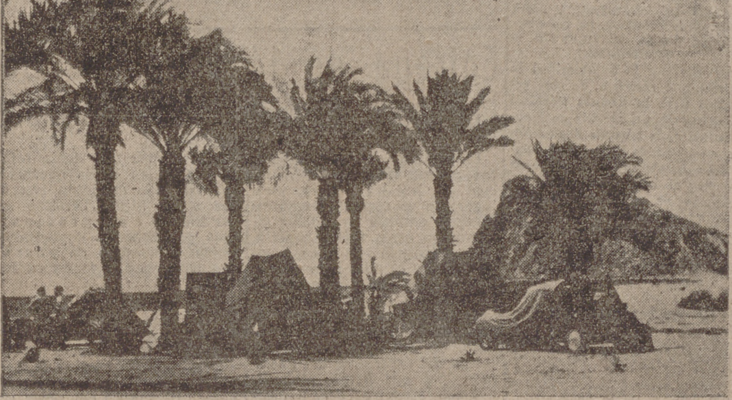
Las costas españolas ofrecen este espectáculo de los extranjeros, que con sus tiendas con cocinas, compran barato en los mercados de los pueblos y agua gratis, disfrutan de sus vacaciones económicas, bajo un sol y clima que envidian a los españoles.