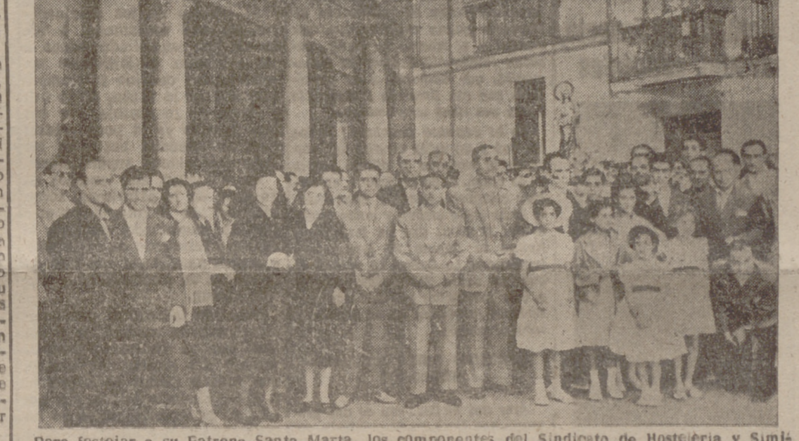
Para festejar a su Patrona Santa Marta, los componentes del Sindicato de Hostelería y Similares asistieron a una misa solemne en la iglesia del Salvador y a la terminación llevaron a su Santa Patrona en procesión hacia la Casa Sindical.