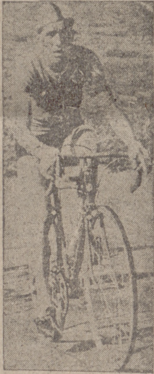
En la etapa de ayer también trepó como nadie nuestro compatriota Bahamontes.