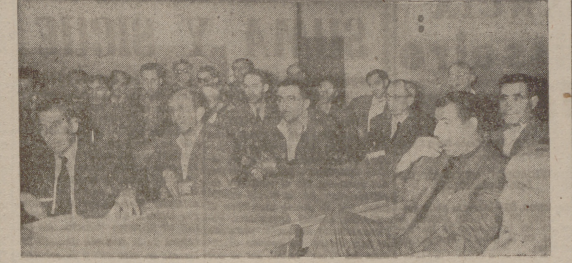
Un grupo de asistentes a la reunión.

En la Casa Sindical "Onésimo Redondo" presidió dos importantes reuniones