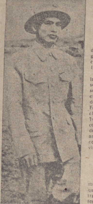
General Van-Tin-Dung, jefe de la delegación de Viet-Minh en la Conferencia de Neung-Gia, donde se trata la posibilidad de un “alto el fuego”.

“Esta mañana—dijo la emisora—, los jefes de las dos delegaciones (Pasa a la cuarta página)