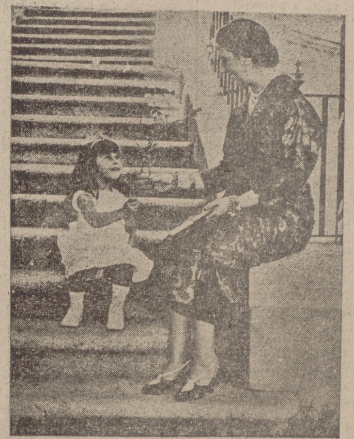
LA ESPOSA DEL CAUDILLO CELEBRO SU ONOMASTICA

Madrid, 17.—A última hora de esta tarde, en uno de los salones del Palacio de El Pardo, ha tenido lugar el acto de la imposición, a la excelentísima señora doña Carmen Polo de Franco, esposa de Su Excelencia el Jefe del Estado, de la Gran Cruz Civil de Sanidad.