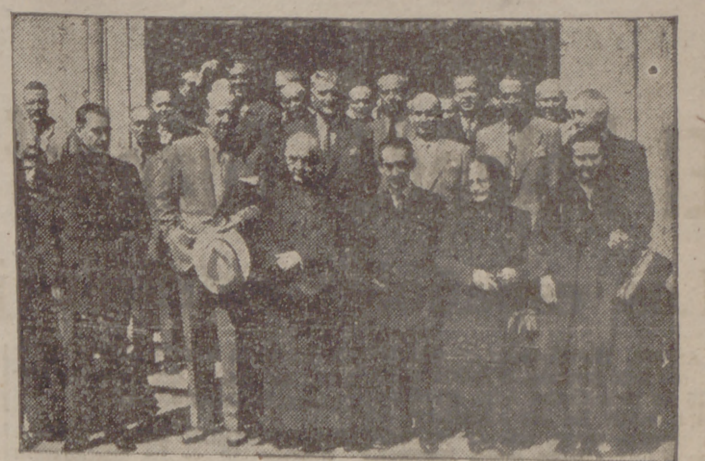
Autoridades y maestros a la salida de la misa celebrada en el Santuario Nacional.