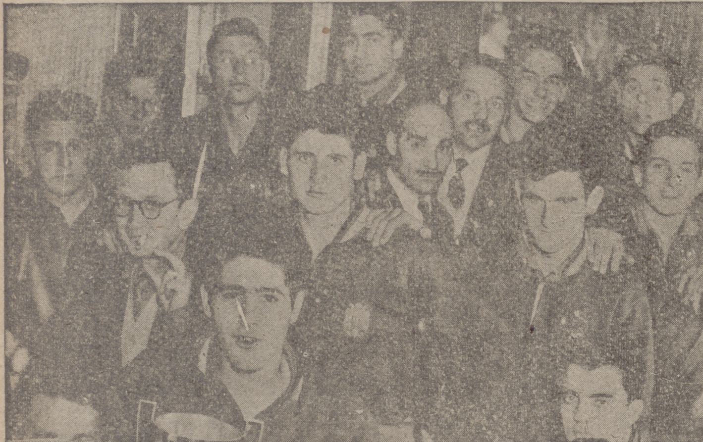
Los jugadores, fotografiados en el tren que los conducía a Madrid.

El entusiasmo ha sido la base de tan magnífico triunfo español