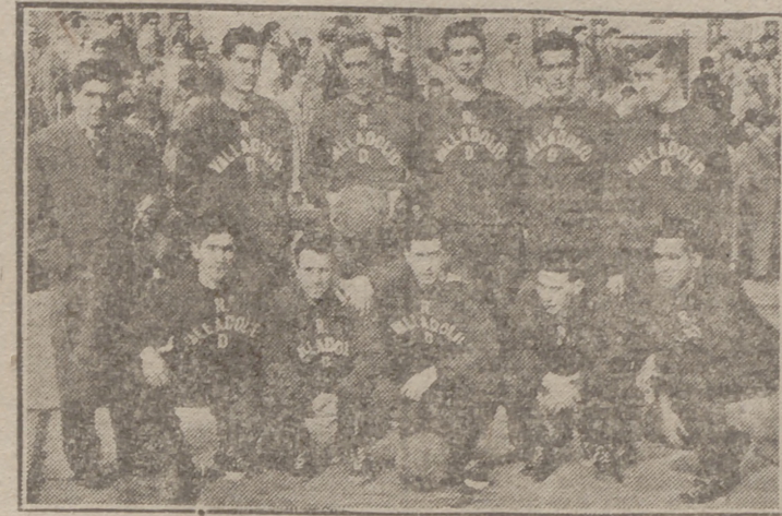
Equipo del Real Valladolid.