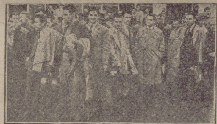
El equipo de fútbol español que habrá de jugar en Turquía, emprende la marcha desde el aeropuerto de Barajas.