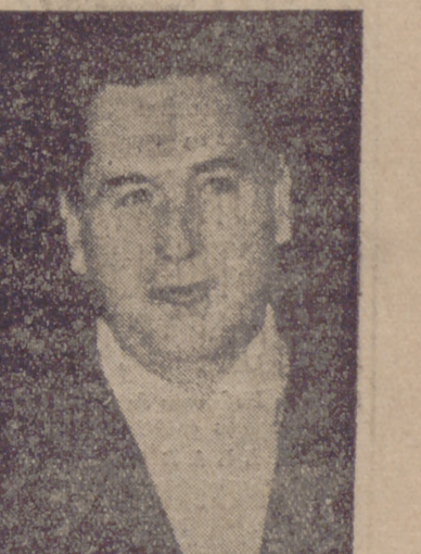
El Presidente de la República Argentina, sobre cuya salud circulan rumores alarmantes, que han sido desmentidos por el periódico "Democracia" de Buenos Aires, según puede usted leer en nuestra crónica de la página 8.