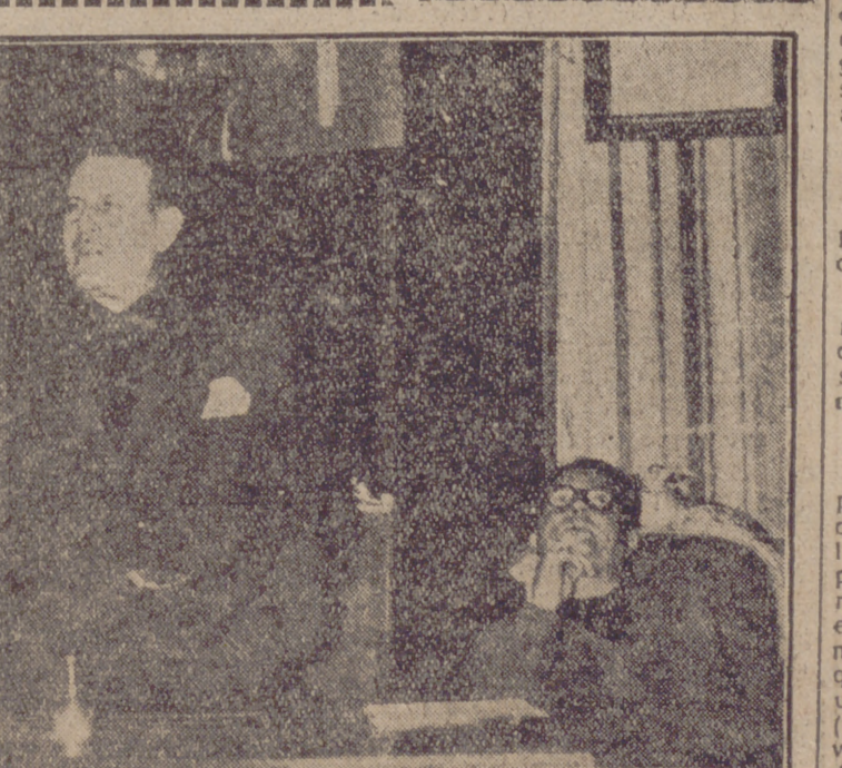
El capitán O. Connell cumplimentó a las primeras autoridades, acompañado del cónsul general de los Estados Unidos, Mr. James E. Brown.—Cifra.

Una vez recibido del señor Calvache el submarino, el comandante general del Arsenal dió posesión del mismo al capitán de corbeta señor Fernández y seguidamente fué izada la bandera nacional. La tripulación cubrió los pasamanos y al desembarcar el contralmirante señor Lallemand le fueron tributados los honores de ordenanza. El submarino salió de la bahía del puerto y recorrió el mismo, volviendo a entrar en la dársena para dirigirse a la estación submarina, donde se hallaban formadas las dotaciones de todas las unidades que forman la flotilla y donde se realizó la presentación de esta nueva unidad. Se dieron los vivas reglamentarios y fueron rendidos honores al nuevo submarino que hoy se incorpora a la Marina de Guerra española. Las características del nuevo barco son: eslora, 84 metros; manga, 6,5; puntal, 6,32; calado, 4; desplazamiento en superficie, 1.050 toneladas; velocidad en superficie, 20,5 nudos; y en inmersión, 9,5 nudos.—Cifra.