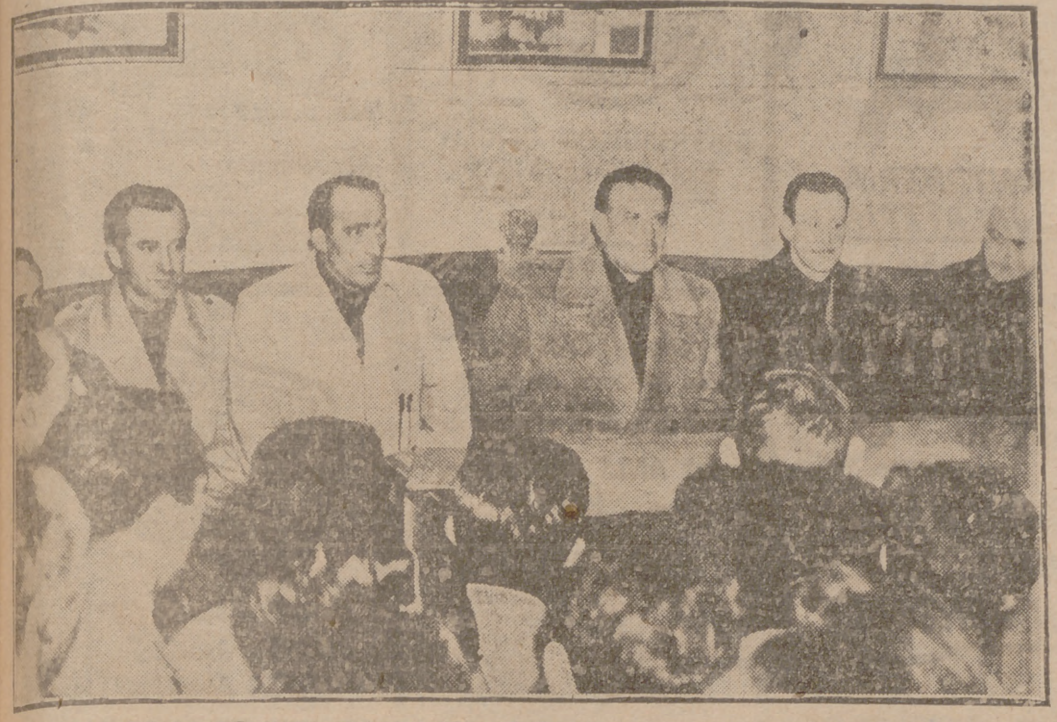
Presidencia de la reunión falangista celebrada en Villalar de los Comuneros