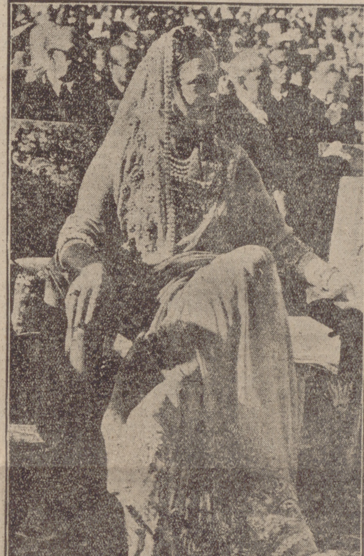
El Aga Khan, príncipe hindú, que ha recibido de sus fieles la ordena del valor de su peso en diamantes, está casado con una francesa. Esta es la Begum, su cuarta esposa, que se llama Yvonne Labrousse y fue, hace ya algunos años —y ustedes perdonen—, "Miss Francia".