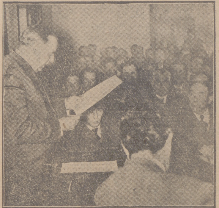
Discusión de la ponencia "Denominación de origen"

El señor Díez Ossorio, ponente de la Comisión, consumió su turno exponiendo a la Mesa y a los asambleístas que, en su calidad de ponente y en nombre de los intereses de Nava del Rey,