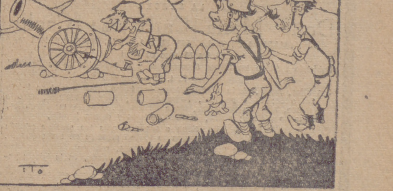
—No le dejéis el cañón, que tiene la costumbre de llevar siempre la contraria!