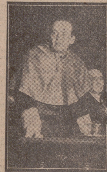
EL VI CONGRESO DE LA ASOCIACION INTERNACIONAL DE DERECHO PENAL