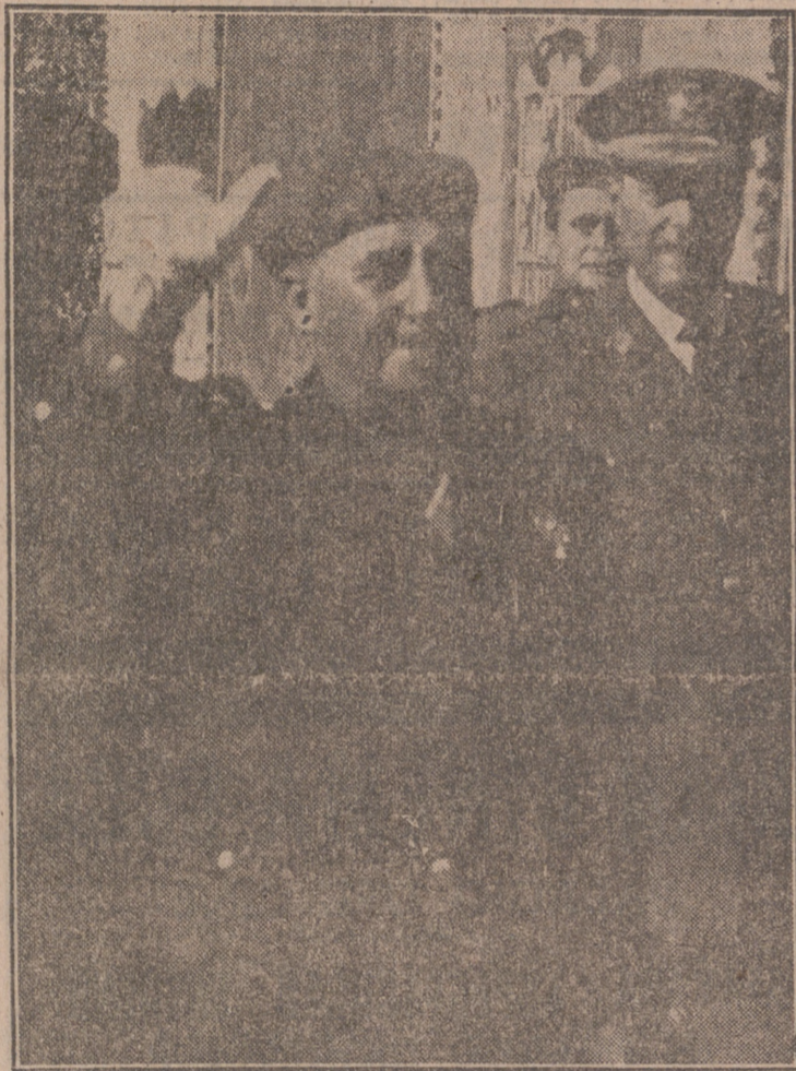
Francisco saluda a los falangistas que le aclaman al entrar en Chamartín.

"La política española no sólo sirve a España, sino al interés general de Occidente"