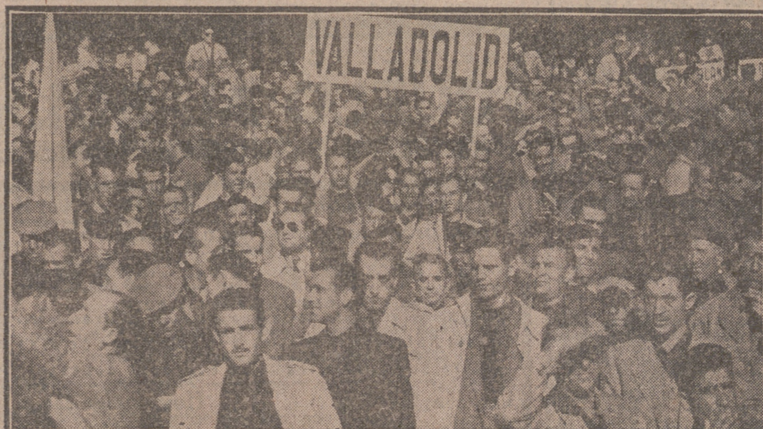
Un grupo de los miles de falangistas que de todos los pueblos de nuestra provincia y de la capital acudieron a Madrid al impresionante acto de homenaje al Caudillo en el XX aniversario de la fundación de la Falange, en unión de todas las jerarquías de la Falange vallisoletana, con nuestro jefe provincial y gobernador civil al frente.

En la fotografía superior aparecen los guiones y banderines de la vieja Falange vallisoletana.