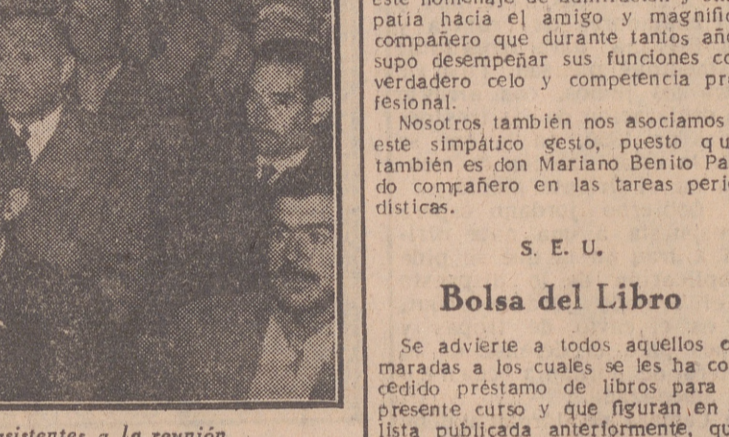
Un grupo de lecheros asistentes a la reunión.

Piden vigilancia de la calidad de la leche