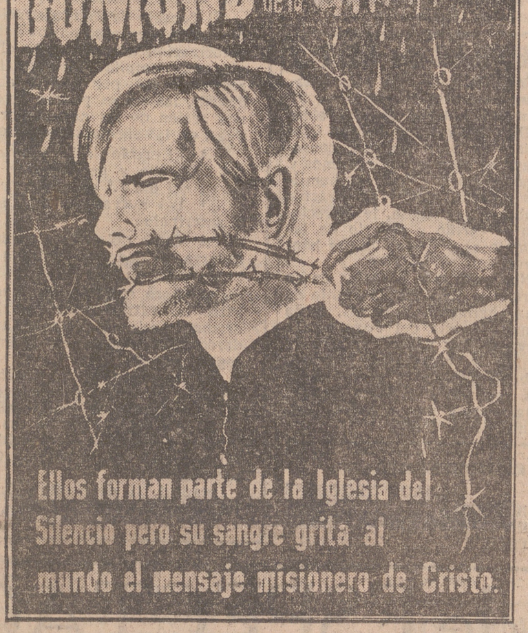
18 DE OCTUBRE DOMINGO de la SANGRE. Ellos forman parte de la Iglesia del Silencio pero su sangre grita al mundo el mensaje misionero de Cristo.

El fortísimo temporal del Estrecho impidió la gran revista naval anunciada