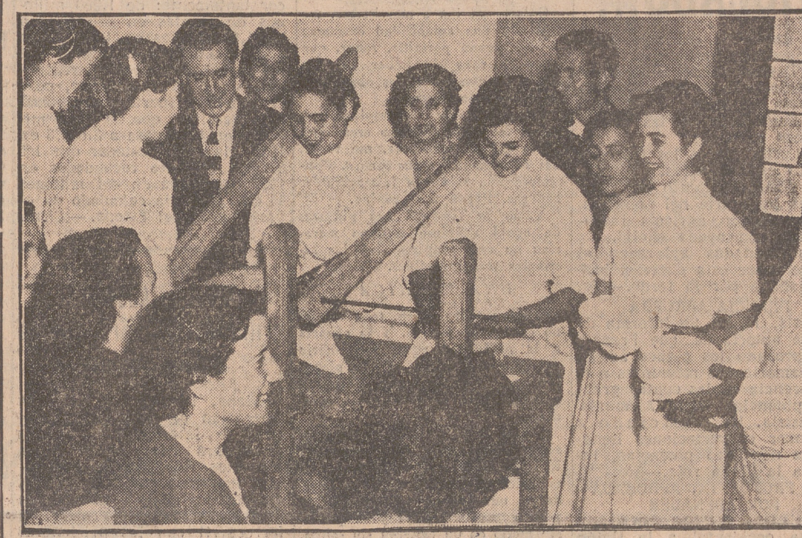
En las fotografías, grupo de cursillistas con el director del cursillo y al calle de Olmedo, y en la otra, fabricación de quesos por las alumnas.