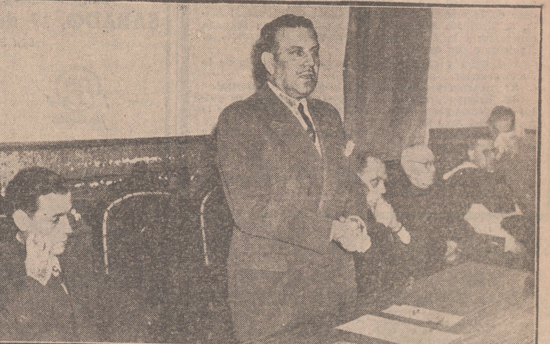
El Excmo. Sr. Gobernador Civil y Jefe Provincial del Movimiento durante las palabras que pronunció en su visita a Olmedo para presidir la clausura de un curso de industrias lán.