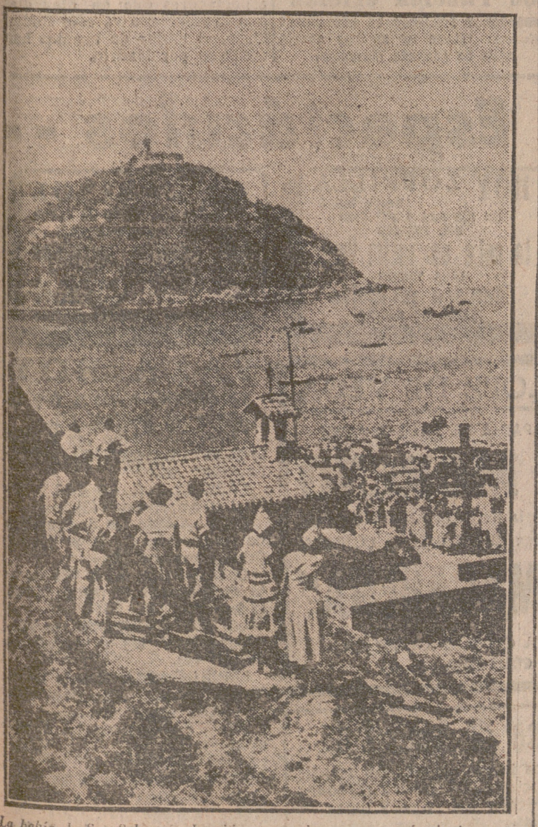
La bahía de San Sebastián ha sido escenario una vez más de las apasionantes regatas de traineras, que dieron como resultado el triunfo de los mocteros de Oribe.