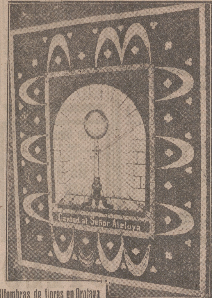
Alfombras de flores en Orotava