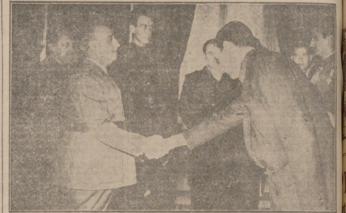
El Pardo.—Su Excelencia el Jefe del Estado con la comisión de estudiantes del SEU que llevarán a Barcelona la salutación Nacional, que, presididos por el ministro secretario general del Movimiento, acudieron a Palacio.

Al acto de entrega asistieron los camaradas FERNANDEZ CUESTA Y PRADERA