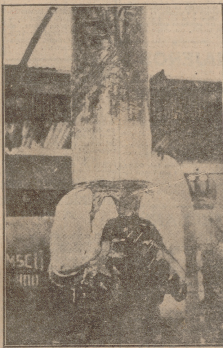
MARCILLA (Navarra).—Un primer plano de la gigantesca muela triple que se utiliza para las perforaciones en el terreno, en los trabajos que actualmente se llevan a cabo para la busca del petróleo.