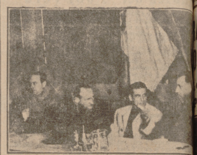
La presidencia del acto.

El domingo clausuró la Campaña de Navidad