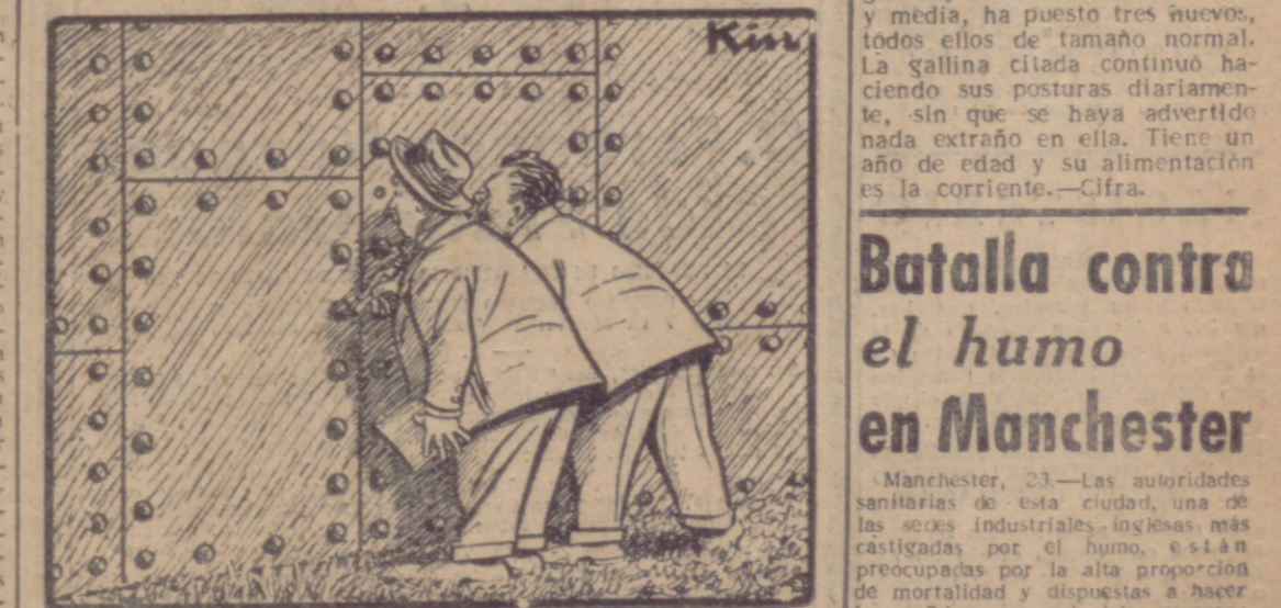
Poco podemos ver por un agujero.—Y con una telaraña que dice "paz".