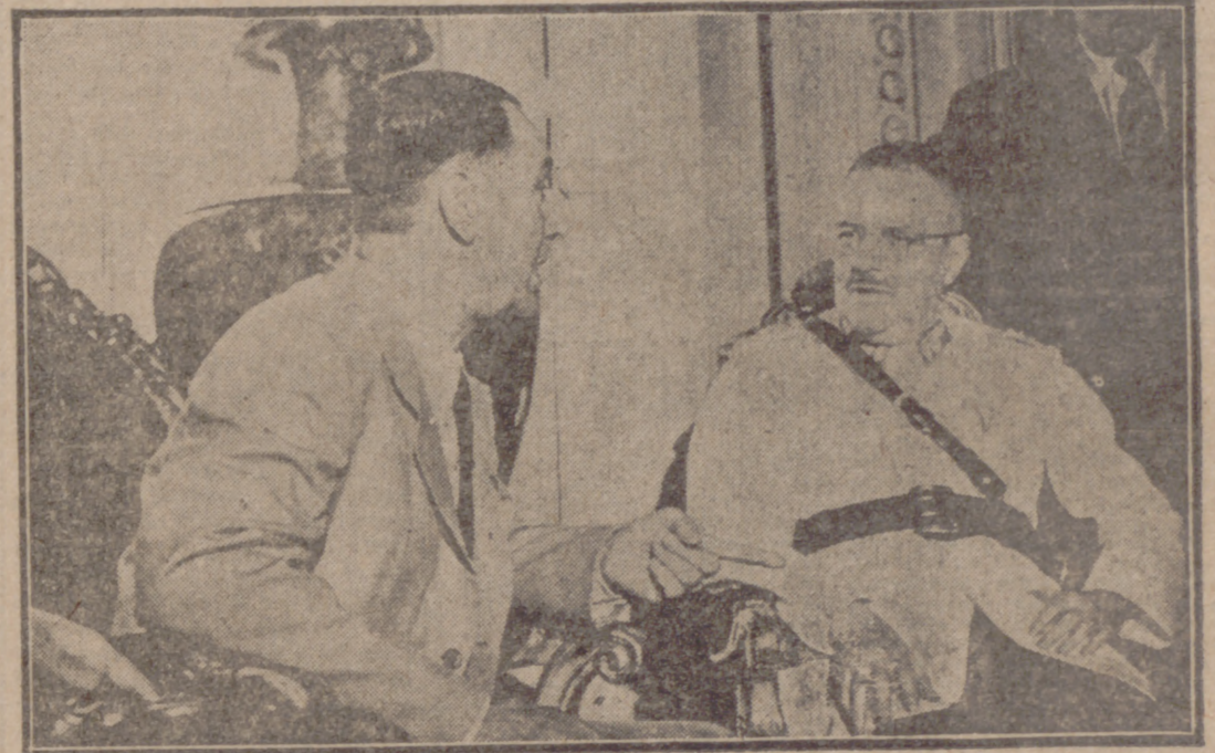
SANTIAGO DE CHILE.— Los presidentes Perón e Ibañez durante la entrevista sostenida en el Palacio de la Moneda, sede del Gobierno chileno, donde trataron de los acuerdos preliminares del acuerdo económico entre ambos países.