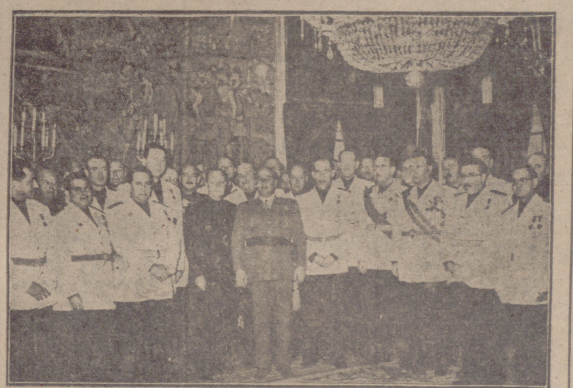
Madrid.—S. E. el jefe del Estado recibió en su despacho del Palacio de El Pardo a la Junta Nacional de la Vieja Guardia, presidida por el ministro secretario del Movimiento, señor Fernández Cuesta, la cual reiteró al Caudillo su adhesión fervorosa.