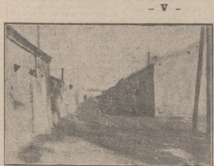
Muchas casas como estas están sometidas a dudosos pleitos de propiedad.

Reanudando el hilo de esta historia.-Crisis en las esperanzas. Pero la autoridad del gobernador civil les ampara.