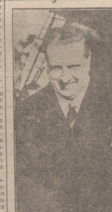
MADRID.—El ministro de Negocios Extranjeros de Siria, doctor Zafer Riail, acompañado de su esposa, ha llegado al aeropuerto de Barajas, donde fue recibido por el ministro de Asuntos Exteriores de España, don Alberto Martín Artajo, y otras personalidades.