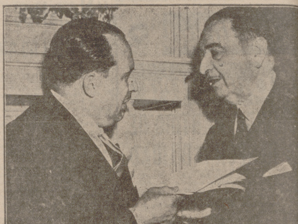
WASHINGTON.—Don Guillermo Sevilla Sacasa, embajador de Nicaragua en los Estados Unidos, entrega al embajador español, don José Félix de Lequerica, de la proposición de que España solicite su ingreso en la Organización de Estados Americanos.