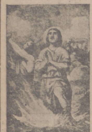
Este santo fue egipcio de origen, idólatra y costumbres. Aunque de posición humilde, sus virtudes y honradez le hicieron distinguir entre sus conciudadanos, lo que no pudiendo tolerar algunos perversos, le acusaron falsamente de haber contribuido al robo con unos malhechores.