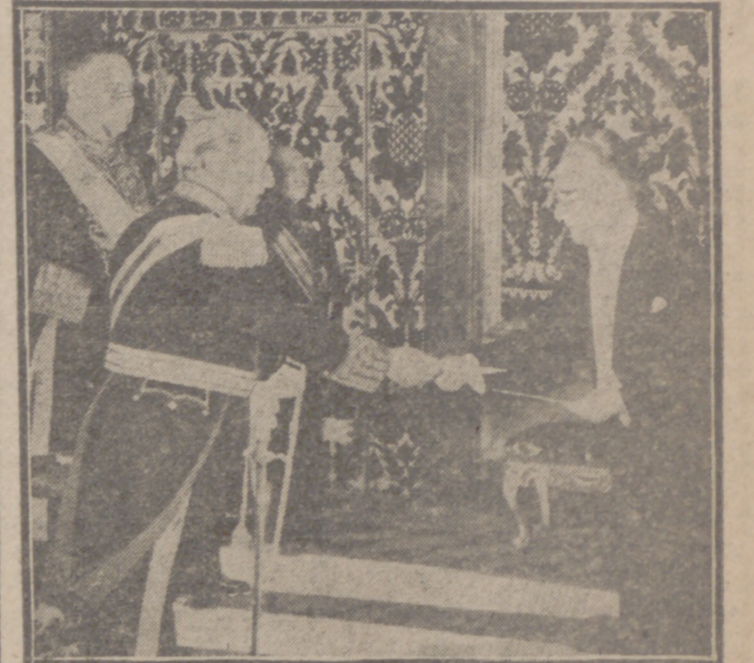
MADRID.—Un momento de la ceremonia de presentación de credenciales del embajador extraordinario de Turquía en España, señor Kemal Kopulu, a S. E. el Jefe del Estado, celebrada en el Palacio de Oriente.