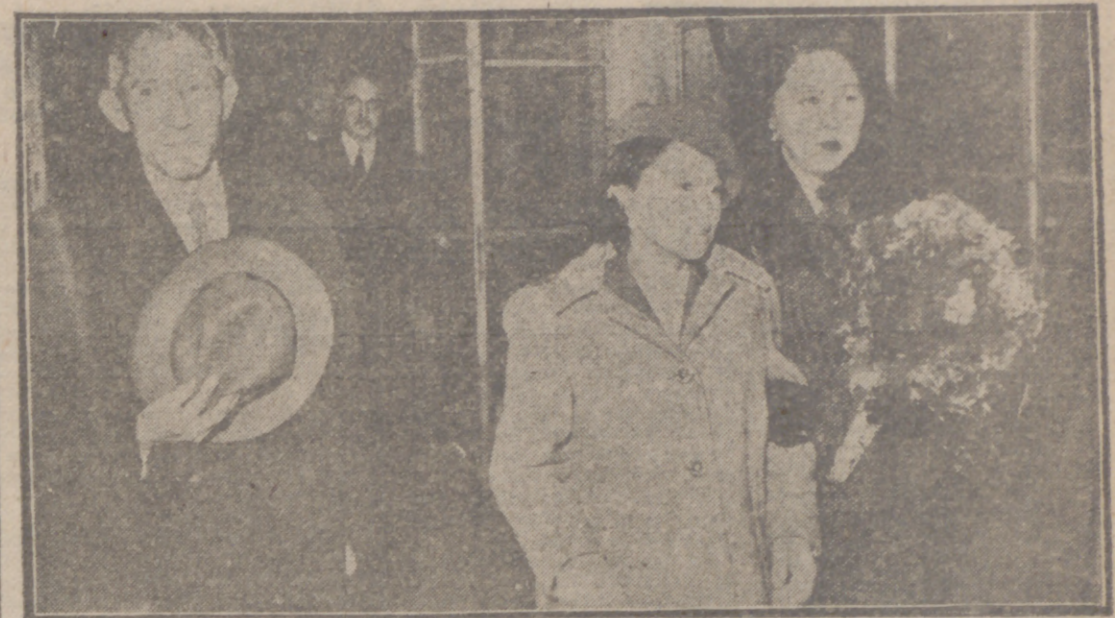
MADRID.—El nuevo embajador del Japon en España, Shinichi Shibusawa, ha llegado a Madrid acompañado de su esposa y sus dos hijos. La fotografía recoge un momento de la llegada al aeropuerto de Barajas.