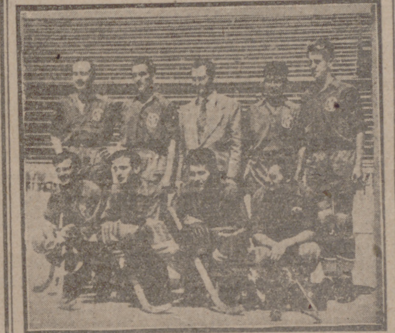
Equipo nacional de hockey sobre patines que se ha clasificado en tercer puesto en los Campeonatos del Mundo. La pasión del torneo y las injustas decisiones arbitrales le privaron del título mundial que poseía cuando fue a Oporto.