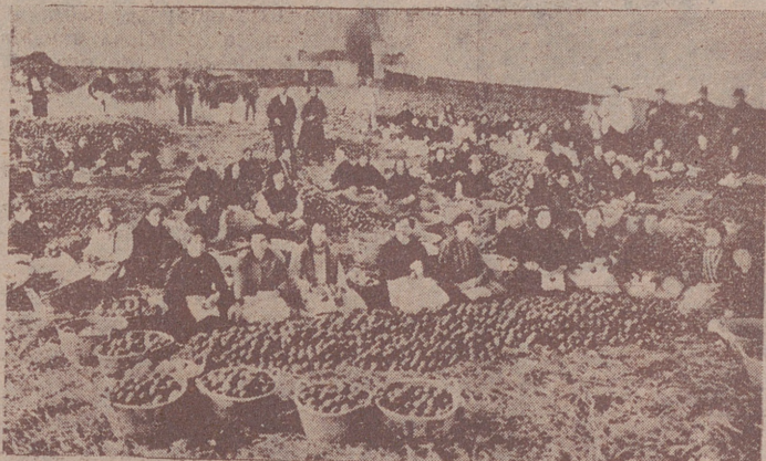
Preparación de naranjas para la exportación en un almacén valenciano.

Es proverbial nuestra riqueza naranjera. Durante un centenio ha sido nuestro país principal abastecedor de externos mercados, agradecidos saboreadores de nuestros renombrados agrios. La misma necesidad de superar esta política comercial hizo que algunos de estos tradicionales clientes procurasen encontrar solución de sus importaciones en la propia producción. Otras tierras, ejemplarizadas en este factor de nuestra fértil zona mediterránea, encontrándose en las mismas condiciones climatológicas y agronómicas, surgieron como competidores de consideración.