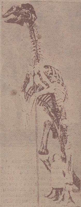
Esqueleto de dinosaurio del Museo de Historia Natural de Nueva York.

—¿Por qué no voy a creer en la noticia? Un ojeador que conocí en Rodesia vió en las