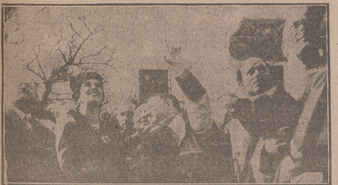
Jaén. — La esposa de Su Excelencia el Jefe del Estado, acompañada del Dean de la Catedral, contempla la parte exterior de la misma. Anteriormente adoró el Santo Rostro y el Cabildo catedralicio le entregó una medallita de la referida reliquia para su nietecita, la hija de los marzuecos de Villaverde. — (Foto CIFRA).