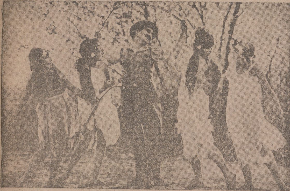
CHARLIE CHAPLIN EN "SUNNYSIDE"

Catedrático de Cinematografía en la Universidad de California del Sur