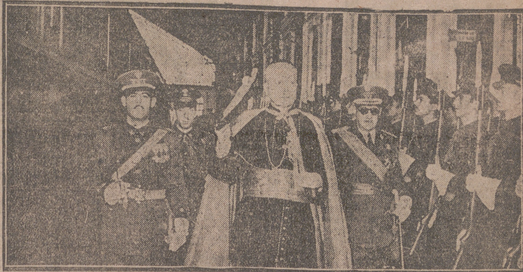
MADRID.—Un momento de la llegada a esta capital del Cardenal Tedeschini, legado pontificio en los actos conmemorativos del Mensaje de Fátima y de Clausura del Año Santo celebrados en Portugal. Fue recibido por los ministros de Educación y de Obras Públicas y otras personalidades. Momentos después ofició una misa ante la imagen de la Virgen de la Almudena.