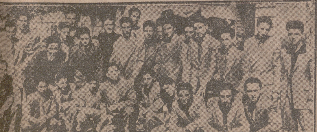
Grupo de aprendices vallisoletanos de los Centros de Trabajo, que han sido premiados en la fase provincial del V Concurso Nacional de Formación Profesional Obrera.