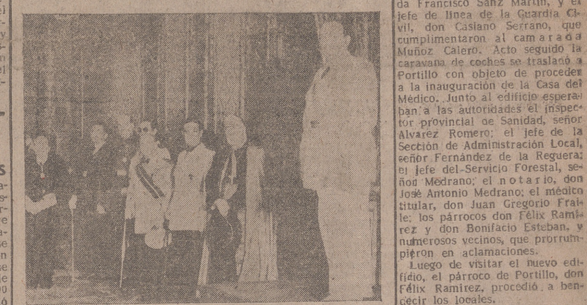
El capitán general, con las autoridades, en la solemne recepción. Ayer, decimoquinto aniversario del Alzamiento Nacional, a las doce de la mañana, en el