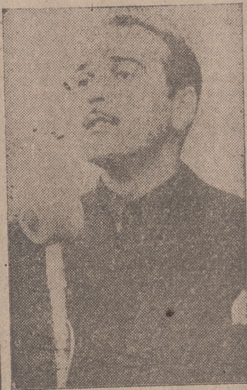
El alcalde de Portillo durante su alocución.