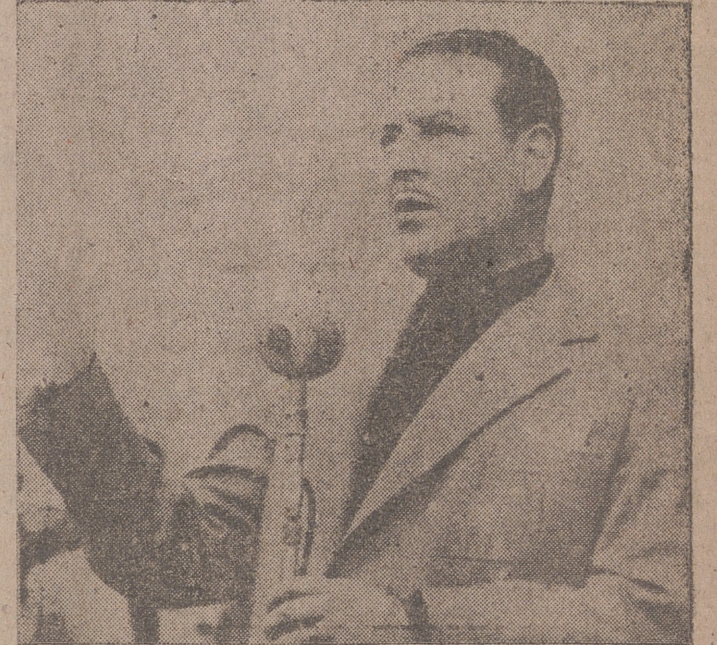
Nuestro jefe provincial y gobernador civil pronunciando su magnífico discurso.

"En la desercion de esas ratas de todos los naufragios, se están aclarando muchas posiciones, especialmente la del enemigo principal: esos llamados demócratas-cristianos."