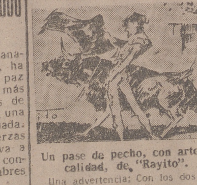
Un pase de pecho, con arte y calidad, de "Rayito". Una advertencia: Con los dos no

Ottawa, 18.—El ministro canadiense de Defensa, Claxton, ha dicho que el concierto de la paz en Corea será una razón más para redoblar los esfuerzos de rearme y no para adoptar una actitud perezoosamente confiada. Agregó que el total de fuerzas armadas del Canadá se eleva a 80.000 hombres, incluido el contingente de nueve mil hombres destinados a Europa.—Efe.