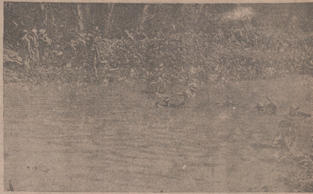
Las tropas francesas, utilizando un cable, atraviesan un río en Indochina, donde continúan los combates.