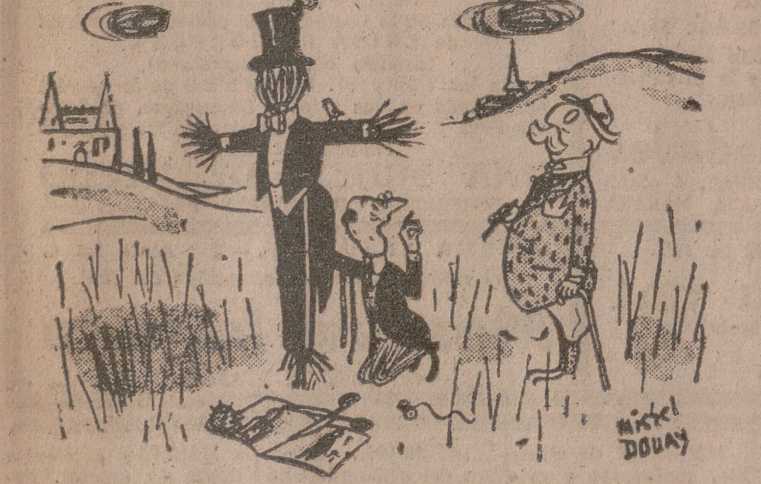
—Con un pequeño retoque en la espalda estará perfecto.

Hace algunos meses, el crítico ruso Schamotz, en la "Literaturnaya Gazeta" escribía, a propósito de "Historias de Kiev", de Janowsky: "Leer treinta páginas de este libro es un verdadero tormento. La obra se cae de las manos. Mejor que seguir una lectura tan mala, el lector prefiere salir de su casa, ir a la calle y mezclarse con la muchedumbre honrada y alegre de las mujeres y los hombres soviéticos, a los que Janowsky ignora tan profundamente."