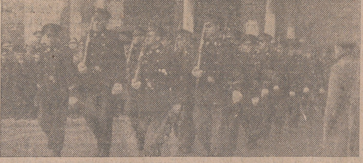
Información gráfica de los actos de Valladolid y Villanueva. (Información en página tercera.)