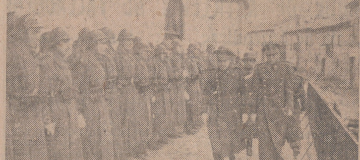
Información gráfica de los actos de Valladolid y Villanueva. (Información en página tercera.)