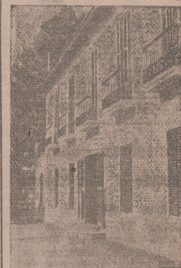
Residencia de invierno de Santa Paz (Alicante)