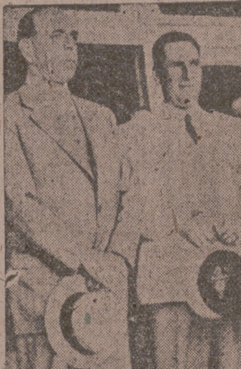
El presidente actual de la República Argentina, general Farrell, y el candidato a la presidencia, coronel Perón