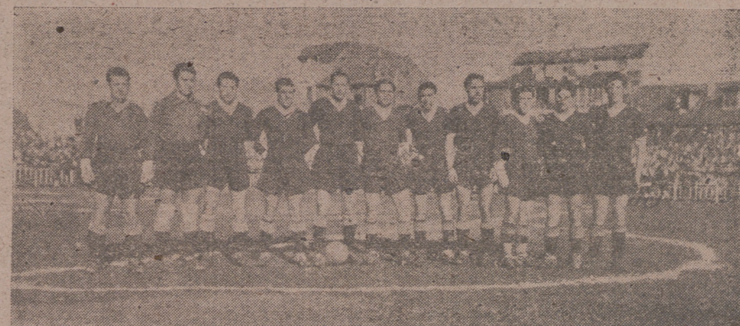
EQUIPO DEL VALLADOLID QUE VENCIO EN LEON.