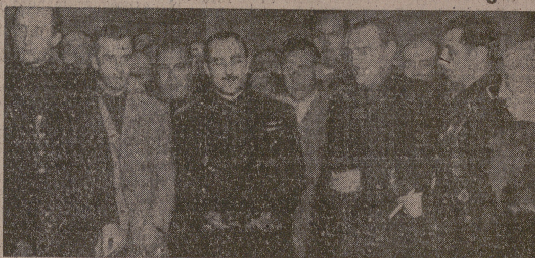
Las jerarquías vallisoletanas con las de Medina de Rioseco