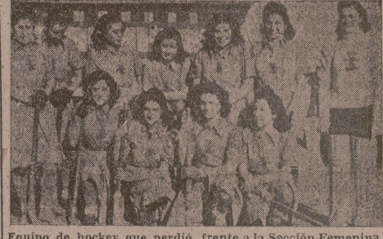
Equipo de hockey que perdió frente a la Sección Femenina de Segovia.