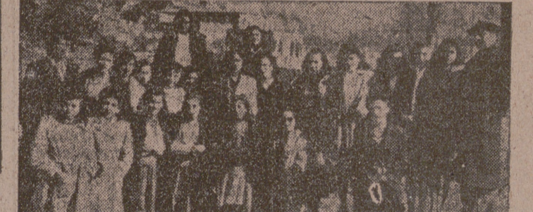
Grupo de productoras de la Escuela de Formación y Hogar que visitó Segovia el pasado domingo.

Las productoras, al final de esta visita, quedaron altamente complacidas, regresando a nuestra ciudad en las primeras horas de la madrugada.