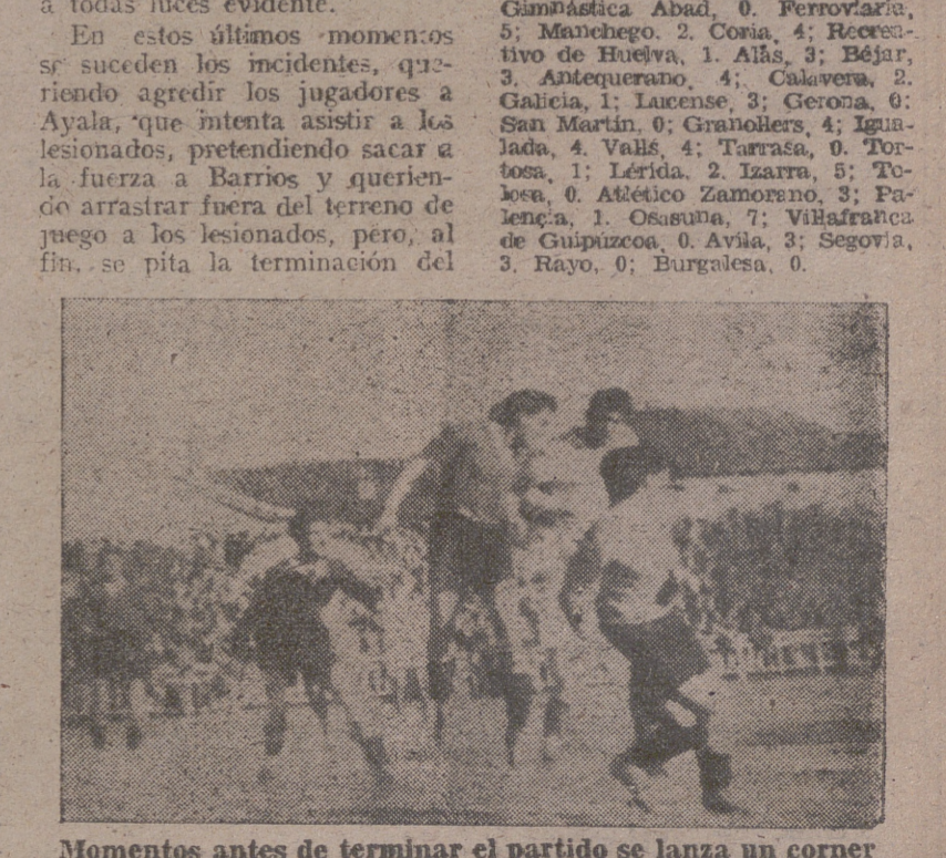
Momentos antes de terminar el partido se lanza un córner y los dos equipos se disponen a resolver la jugada

En los partidos celebrados ayer, correspondientes a la Copa Federación Española de Fútbol, se obtuvieron los siguientes resultados: Huesca, 0; Sans, 2. Electromecánica, 1; Deportivo Egabete, 1. Imperial, 5; Yecla, 1. Pasencia, 1; Tomelloso, 1. Cultural de Durango, 4; Deportivo Alavés, 2. Avilés, 9; Langreano, 0. Juventud, 0; Gijón, 2. Mieres, 2; Arnedo, 0. Oñiz, 1; Aguirre, 1. Cieza, 5; Gamañaca Abad, 0. Ferroviario, 5; Manhego, 2. Coria, 4; Recreativo de Huelva, 1. Añás, 3; Béjar, 3. Antequera, 4; Calavera, 2. Galicia, 1; Lucense, 3; Gerona, 0. Ayala, que intenta asistir a los lesionados, pretendiendo sacar a la fuerza a Barrios y queriendo arrastrar fuera del terreno de juego a los lesionados, pero, al fin, se pita la terminación del