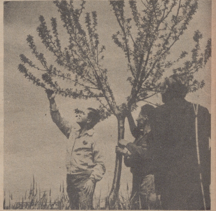
Sobre el terreno y ante el problema, el agente del S. de E. Agraria, aconseja y orienta al agricultor.

—Los Planteles de Extensión Agraria ofrecen a los jóvenes del