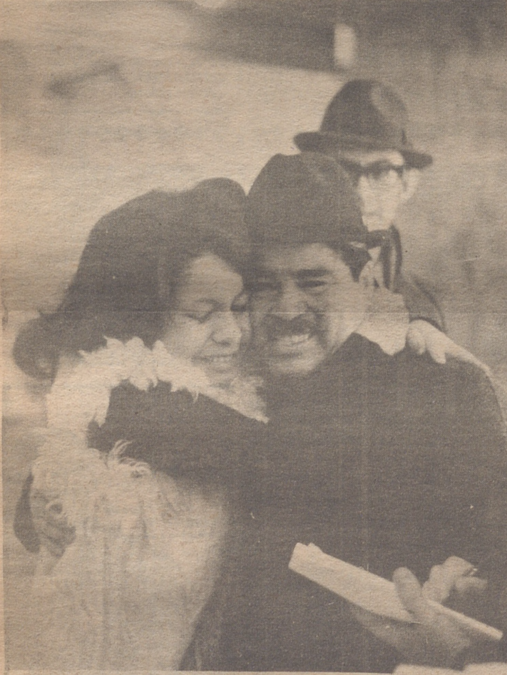
MADRID.— Juan José Torres, ex presidente de Bolivia, ha llegado a Madrid en visita privada. Su hija que estudia en España, acudió a recibirle al aeropuerto; así como numerosos periodistas.