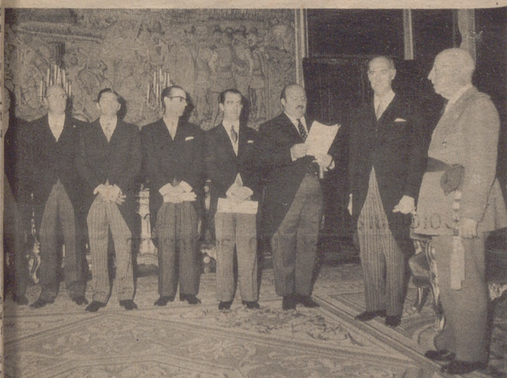
EL PARDO.— S. E. el Jefe del Estado ha recibido en audiencia civil en el palacio de El Pardo a los presidentes de las comisiones y ponencias del III Plan de Desarrollo, a quienes acompañaba don Laureano López Rodó, Ministro Comisario del Plan de Desarrollo.