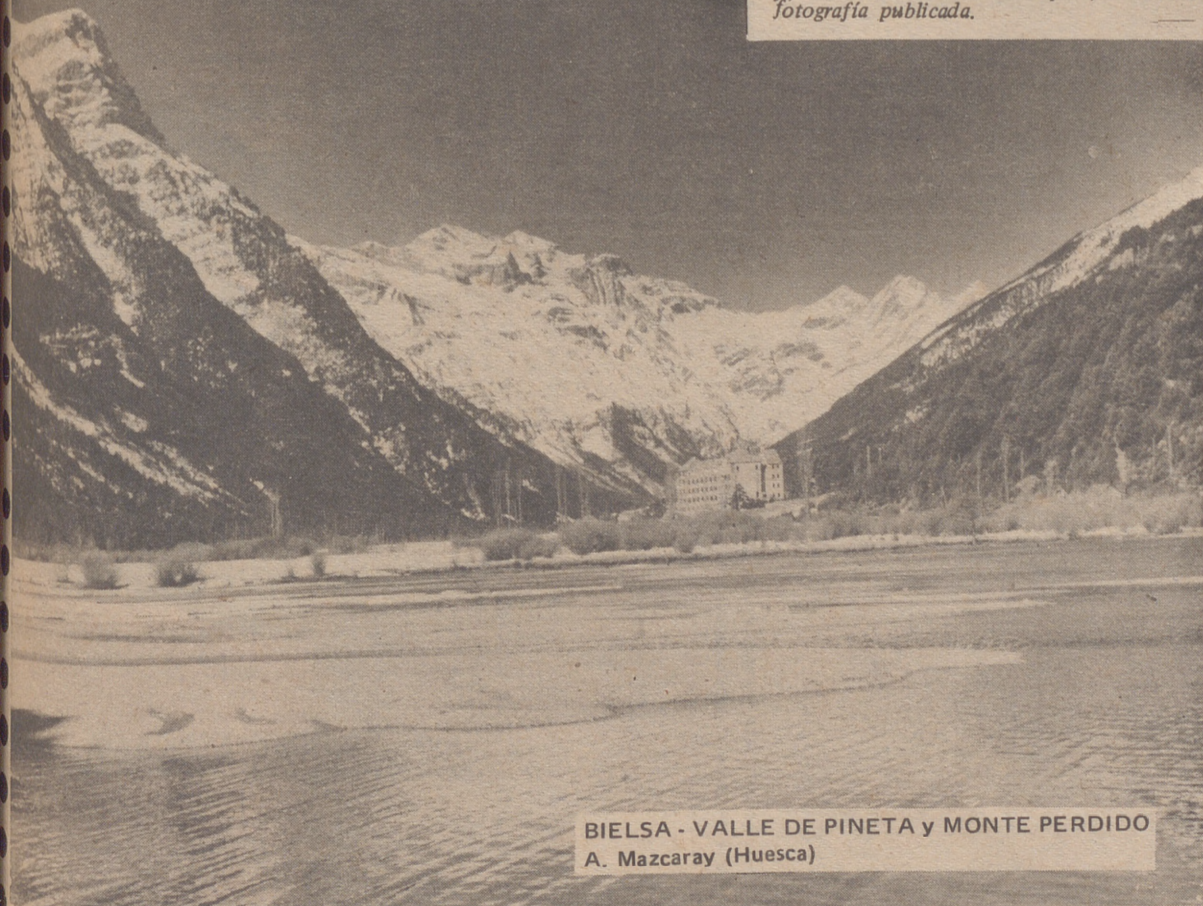
BIELSA - VALLE DE PINETA y MONTE PERDIDO A. Mazcaray (Huesca)

Sigue la abundosa correspondencia llegando cada día. Un poco de paciencia y, cuando menos lo espere, verá su fotografía publicada.