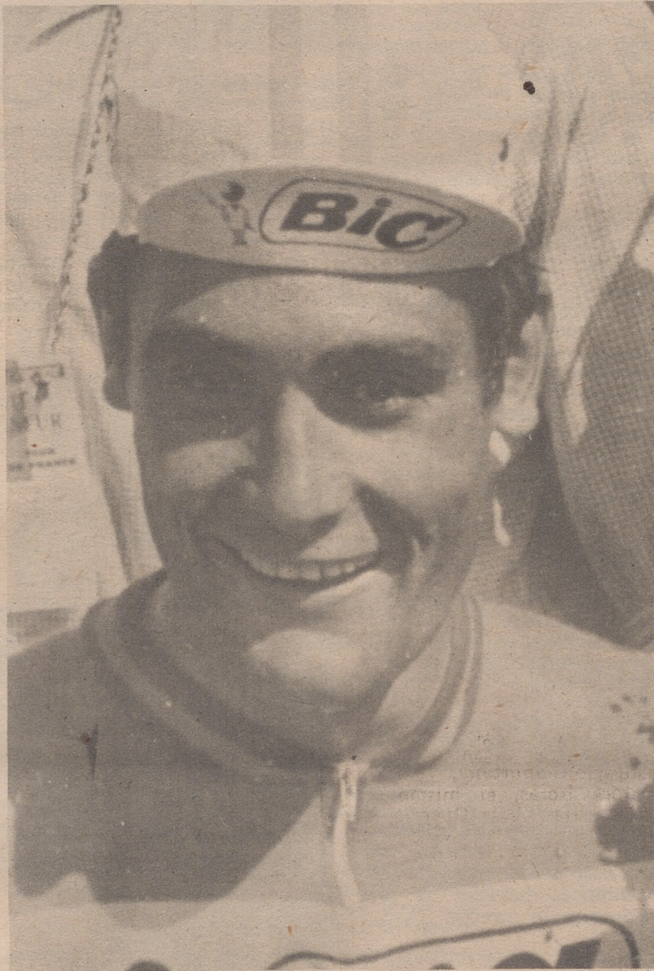
El destino nos ha privado de ésta gran alegría. Luis Ocaña ha sido baja en la gran ronda francesa.

En la meta de Luchón se respiraba ambiente de fiesta "a la española". Luis Ocaña hubiese sido entusiásticamente aclamado por cientos de compatriotas, desplazados exclusivamente para vitorearle.