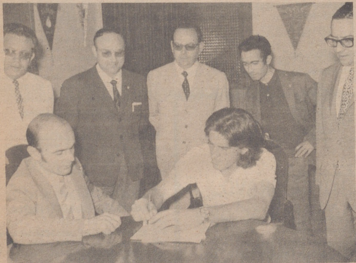
MALAGA.— La que estampó Viberti en el nuevo contrato que le liga dos temporadas más con el Málaga, que unida al año que le faltaba para cumplir su primer contrato, son tres las temporadas a las que se ha comprometido el famoso jugador con el club Malagueño.