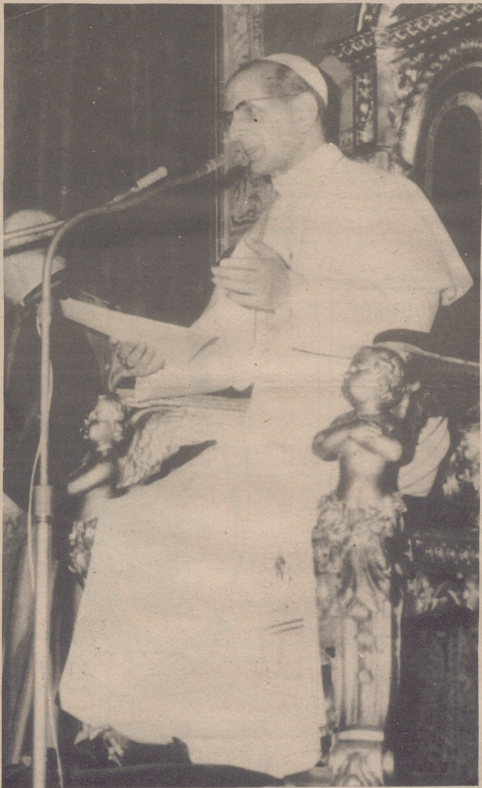
"Pablo VI ha hecho pública una carta con motivo del ochenta aniversario de la 'Rerum Novarum' que atisba una nueva época para el campo de reconocimiento de la autonomía de los laicos en las cosas temporales".— (Foto Europa Press).

UN CIERTO CLERICALISMO EXISTENTE TODAVIA, MAXIMO OBSTACULO PARA SU DESARROLLO