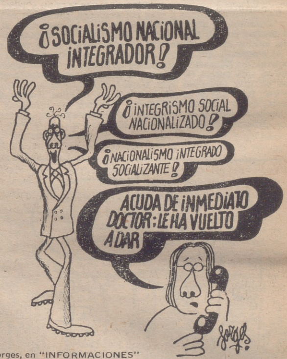
Forges, en "INFORMACIONES"