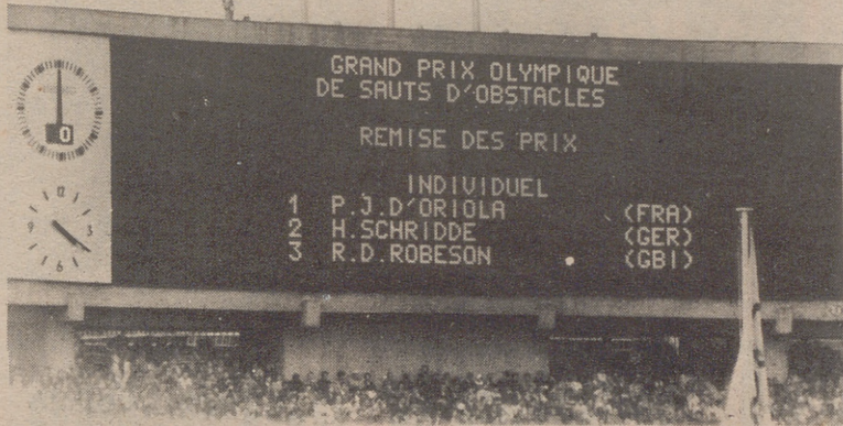
Tableros luminosos de la Olimpiada de Tokio. Los de Munich serán todavía mucho más modernos y fieles, si cabe.

os cuatro tableros de los pabellones se emplearán un total de 600 bombillas, que los resultados de las de gimnasia y ano. En la piscina se emplearán tableros convencionales. controlados igualmente de electrónicos y con las planchas de de la piscina. Cuando el toque la plancha a su la meta, su tiempo inmediatamente en el luminoso. Cuando todos deportistas hayan llegado a el cerebro electrónico ará en segundos la ción final.