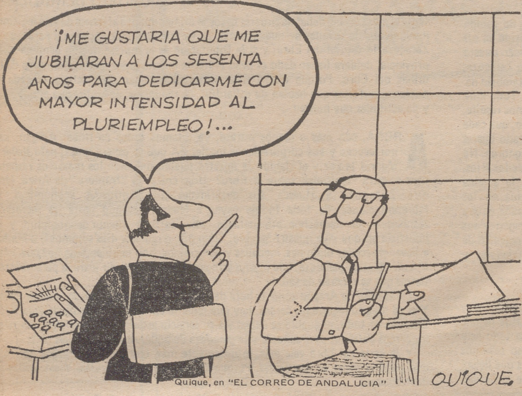
Quique, en "EL CORREO DE ANDALUCIA"