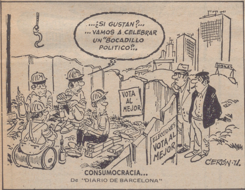
CONSUMOCRACIA... De "DIARIO DE BARCELONA"