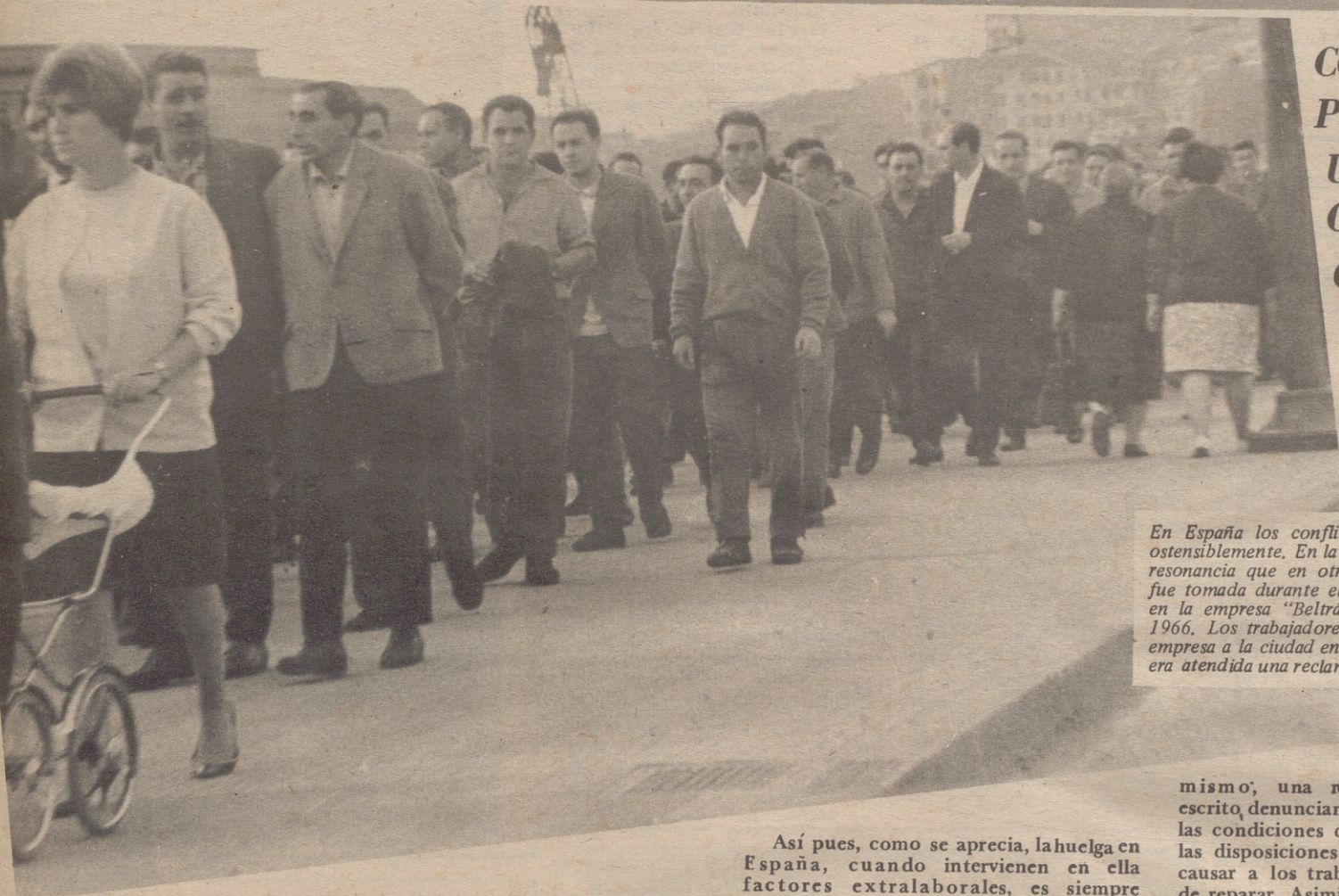
En España los conflictos colectivos disminuyen ostensiblemente. En la actualidad ya no alcanzan la resonancia que en otras ocasiones. La fotografía fue tomada durante el conflicto colectivo surgido en la empresa "Beltrán y Casado" de Bilbao, en 1966. Los trabajadores marcharon a pie desde la empresa a la ciudad en señal de protesta porque no era atendida una reclamación salarial.

COMO DEBE PRODUCIRSE UN CONFLICTO COLECTIVO PARA SER LEGAL EN ESPAÑA