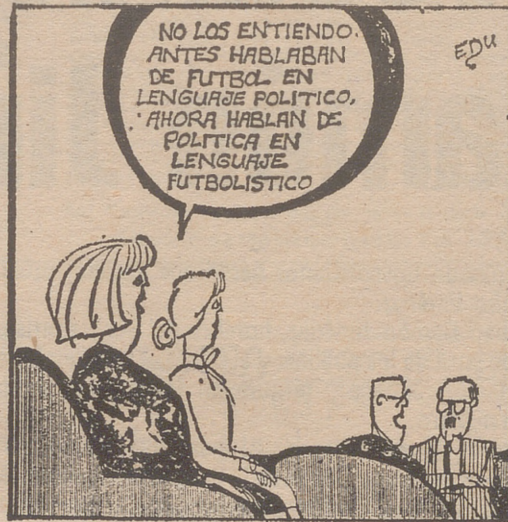
(Edu, en "Ya")