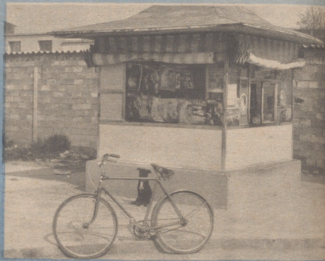
Exceptuando el grupo escolar, el "kiosko" es el único contacto del barrio con la cultura.

Si miramos desde este prisma no vemos prácticamente nada. Desde el punto de vista urbanístico veíamos cosas, mal hechas sí, pero al fin y al cabo hechas. Hoy ni eso. Si exceptuamos el