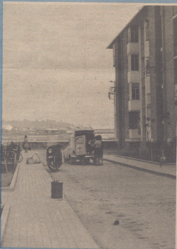
Es necesaria una cultura entroncada con la realidad social de sus habitantes.

otra cosa que despiere hasta el sector donde encuentran estos centros culturales. También se puede afirmar que aunque llevarán estas actividades al barrio, no tendrían la mínima aceptación.