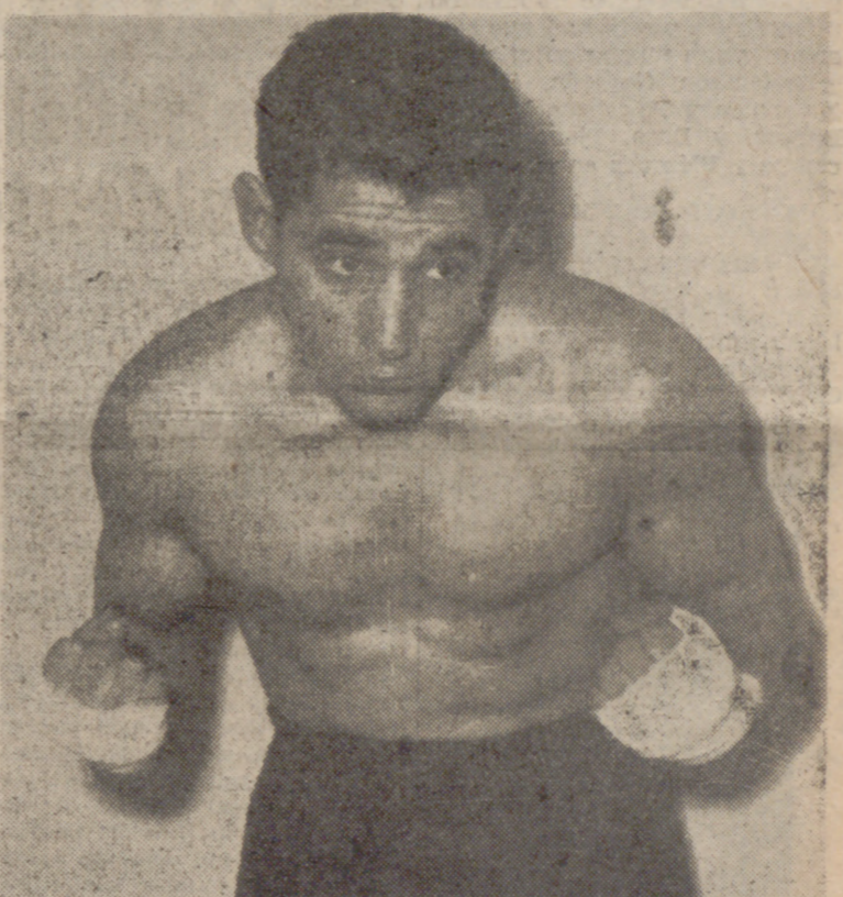
LA CORUÑA. (Añil).—En la vecina localidad de Carballo, y con motivo de las fiestas patronales, se celebró una velada de boxeo controlada por la Federación Gallega, cuyos resultados de los diversos combates fueron los siguientes: