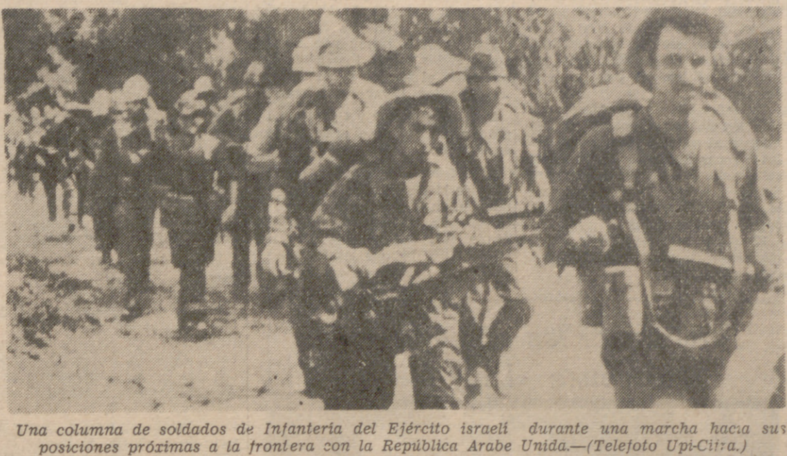
Una columna de soldados de Infantería del Ejército israelí durante una marcha hacia sus posiciones próximas a la frontera con la República Árabe Unida.

El horno nacional, y el internacional, no están para bollos y pasteles, sino tan sólo para el pan de cada día y de cada realidad, que, con buen talante y voluntad de hacer, puede ser pan blanco y sabroso y, además, tranquilo sustento en nuestra marcha hacia el porvenir.