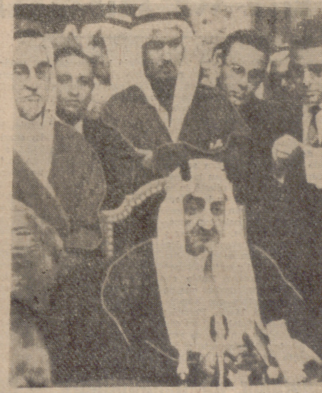
BRUSELAS.—El rey Faisal de la Arabia Saudí dando una conferencia de Prensa en esta ciudad.