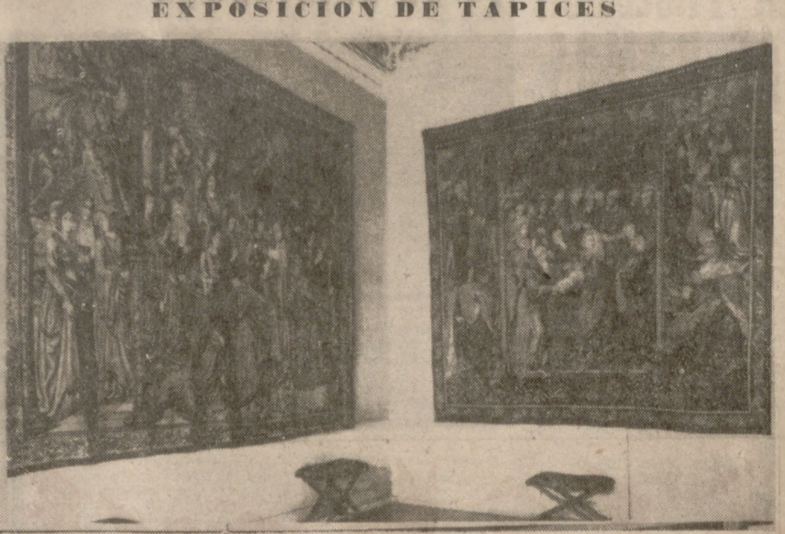
MADRID.—Una veintena de tapices religiosos serán exhibidos por el Patrimonio Nacional en las habitaciones que pertenecieron a la reina María Cristina.