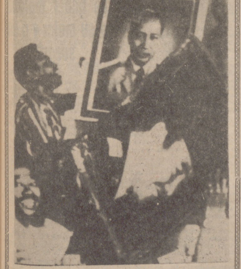
YAKARTA (Indonesia).—El retrato del depuesto presidente Sukarno es reemplazado por el del general Suharto en el Club de Prensa de Yakarta.