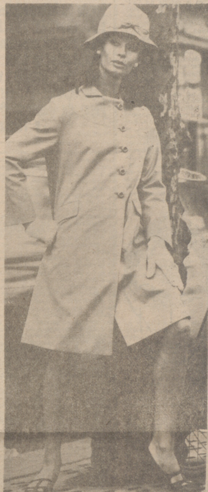
Este es un elegante modelo "Conda" para la lluvia, diseñado por Ponsetti. En grueso "whipcord", de terilene, en color amarillo, tanto el impermeable como el sombrero.

Aldo Roy incluye una gran variedad de sweaters y faldas, con cuello hermeticamente cerrado, tipo polo, y tejido en canalé o escote amplio redondo, mangas pegadas y abrochado en el delantero con una fila de botones