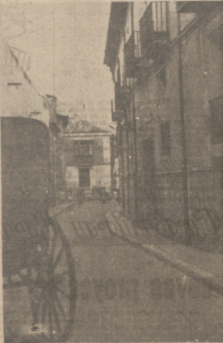
expropiación del inmueble número ocho de la Plaza de San Miguel para ensanche de ésta y de la calle de León, sin otras explicaciones a la población, que

Viene éste a cuento de que en la sesión municipal plenaria del jueves último fue acordada la