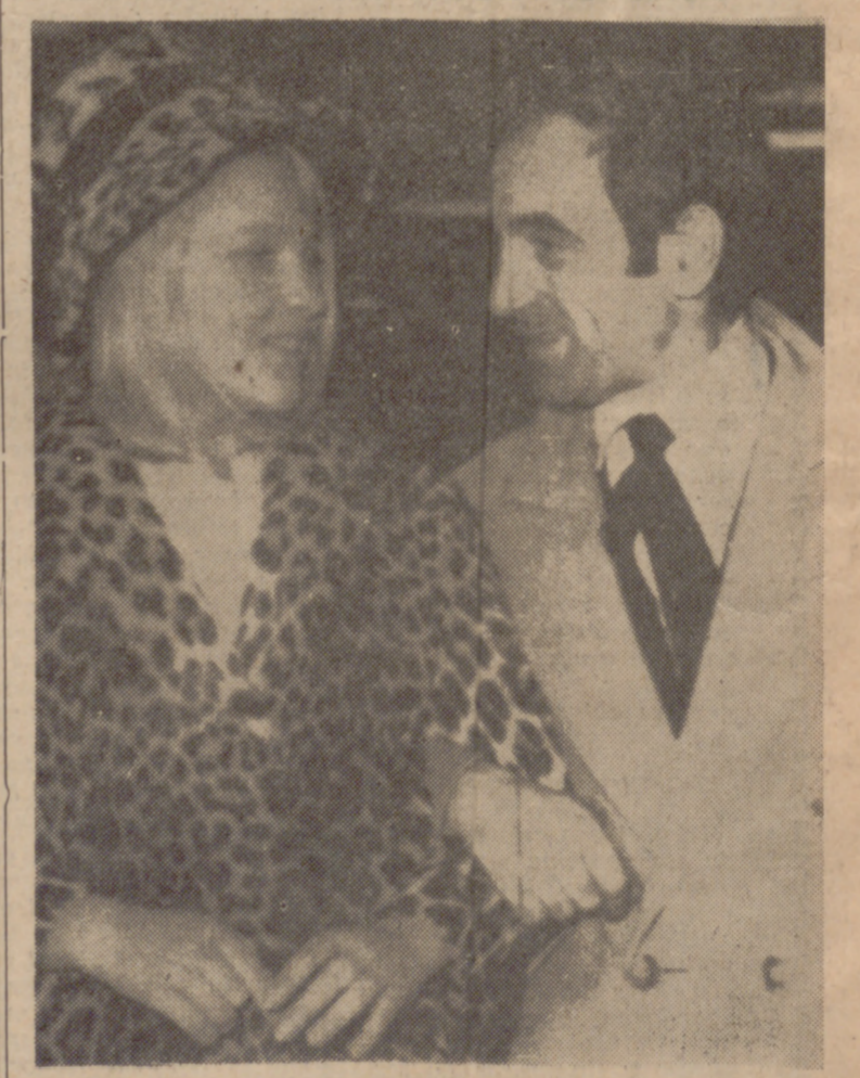
PARIS.—El cantante Charles Aznavour del brazo de la sueca Ulla Thurgel. La pareja ha anunciado que contraerá matrimonio civil el 11 de este mes, en Las Vegas (Nevada).