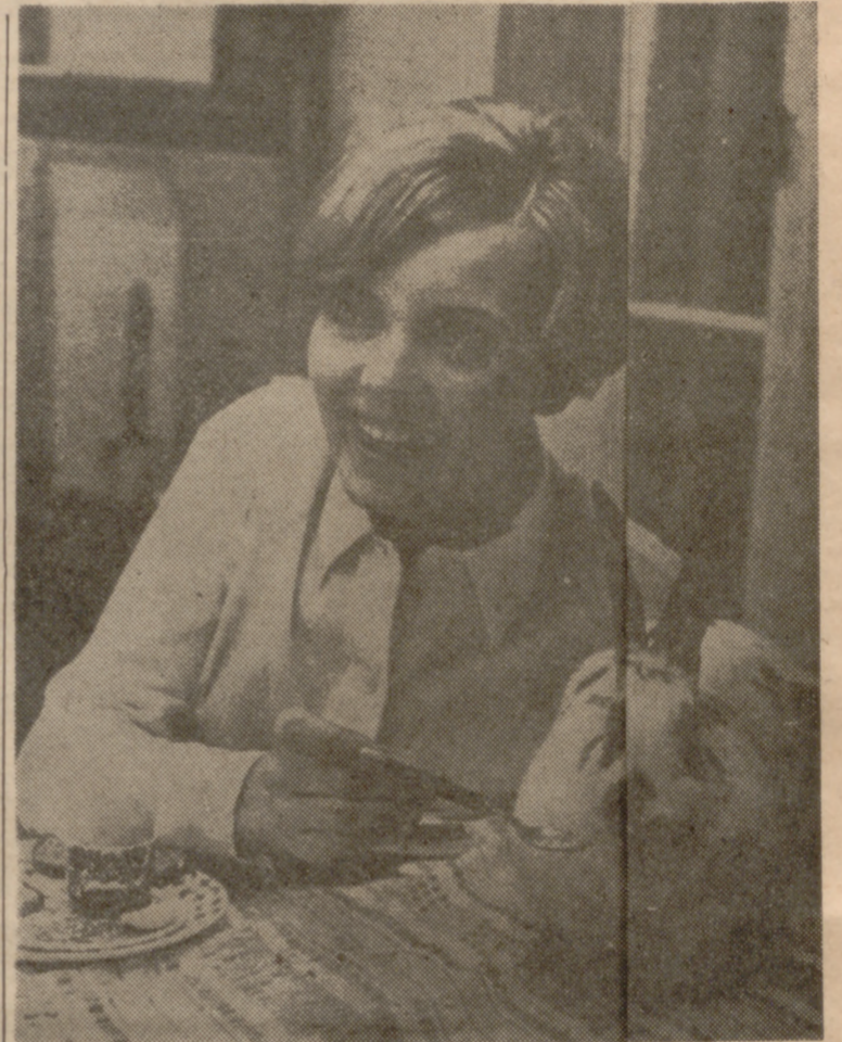
EL HOGAR DE CHERYL

No es un producto del cine ni de la publicidad. Es una gran artista, una dulce muchacha y una encantadora ama de casa... cuando está en casa, que es casi nunca.