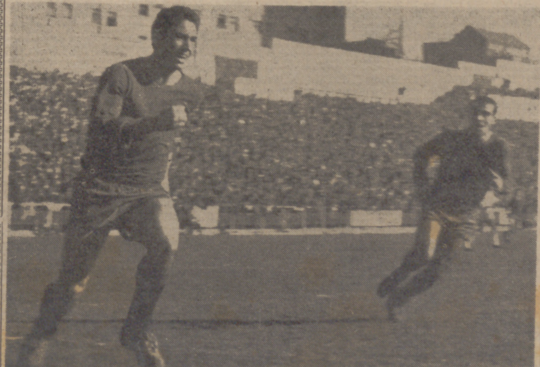
No ha podido ser mejor el comienzo del año para el Real Valladolid, que protagonizó la hazaña más destacada del Grupo Norte con su triunfo en Valdecañas. Un gran partido de todo el equipo vallisoletano y un excelente auspicio para el año que acabamos de estrenar. (En páginas interiores, "Castilla Deportiva", con amplia información gráfica y literaria de este choque y de toda la jornada deportiva.)